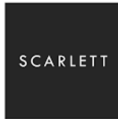
Gambar 1. 1 Logo Perusahaan Scarlett Whitening