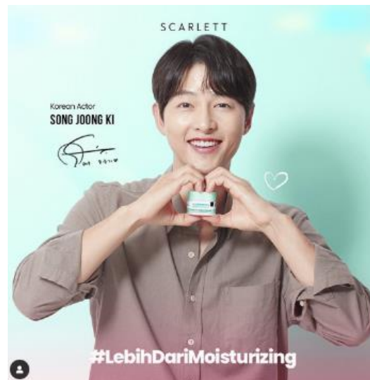
Gambar 1. 3 Brand ambassador Scarlett Whitening

memenangkan penghargaan "Brand of the Year 2021" dalam kategori "Serial Drama Terbaik" dan memenangkan penghargaan "Loyalitas Pelanggan Merek 2021", memenangkan dua penghargaan. Song Joong-Ki juga telah menerima banyak penghargaan dalam beberapa tahun terakhir, termasuk Penghargaan Produser Korea serta banyak penghargaan lainnya. Bahkan ketika Scarlett Whitening resmi mengumumkannya kolaborasi dan mengubah aktor Song Joong-ki menjadi sebuah Brand Ambassador, ini sudah menjadi wacana di kalangan masyarakat Indonesia dan menjadi trending di Twitter. Selain trending Sosial Media Twitter, juga menjadi perbincangan media sosial Tiktok. Selain itu, iklan Scarlett Whitening x Song Joong-Ki telah diunggah ke saluran YouTube Scarlet Whitening telah mencapai 2,6 juta penonton (Ina, 2021).