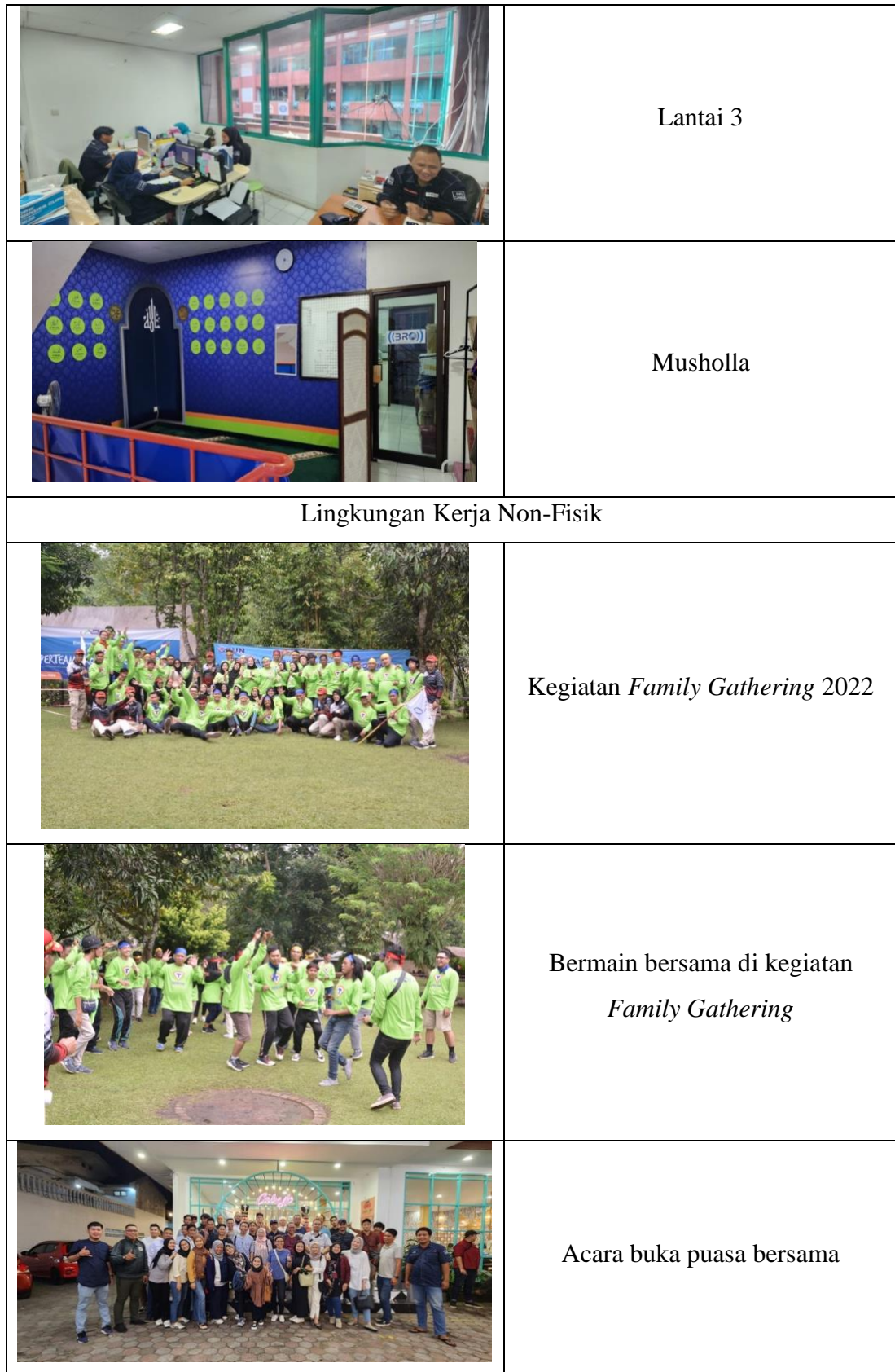
Gambar 1. 3 Kondisi Lingkungan Kerja ABC Express Cargo