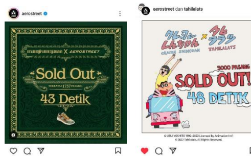
Gambar 1. 3 Postingan produk Sold Out dalam waktu kurang dari satu menit

@aerostreet.shoe dan @aerostreet.slipper. Banyaknya informasi dan promosi yang disampaikan aerostreet tentunya akan terdapat pengaruh pada perilaku konsumtif.