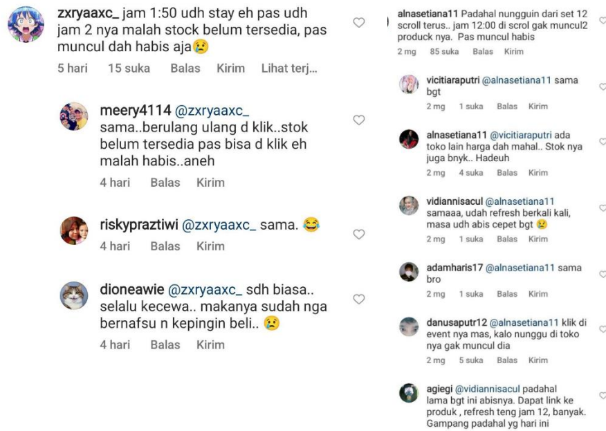
Gambar 1. 4 Komentar kekecewaan pengguna Instagram yang tidak kebagian produk

dengan memperluas cakupan konsumen sesuai dengan promosi yang dilakukan oleh sebuah brand.