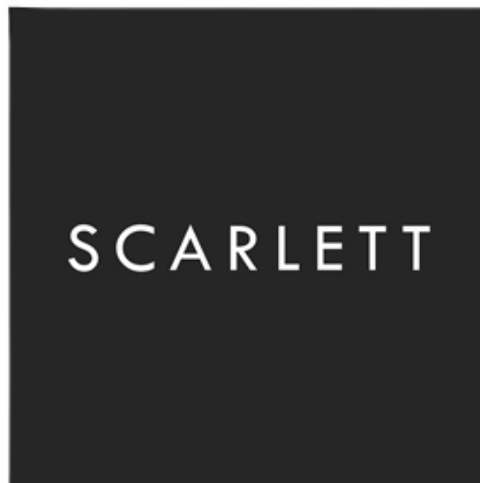
Gambar 1.1 Logo Scarlett Whitening

Scarlett Whitening adalah sebuah perusahaan produk perawatan kecantikan lokal yang didirikan oleh seorang selebriti Indonesia bernama Felicya Angelista pada tahun 2017. PT. Opto Lumbang Sejahtera menjadi perusahaan yang mengelola Scarlett Whitening. Dilansir dari laman website (Kumparan.com, 2022) bahwa produk-produk yang dihasilkan oleh Scarlett Whitening telah terdaftar di BPOM dan dinyatakan sebagai produk yang aman untuk digunakan termasuk pada kalangan ibu hamil dan menyusui.