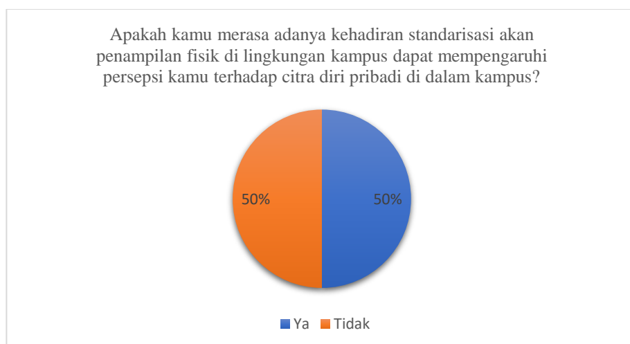
Gambar 1.5 Diagram Pra Riset IV

Sebanyak 80% mahasiswi Telkom University merasakan hal tersebut dapat menjadi standarisasi penampilan fisik di lingkungan kampus dan sebanyak 20% mahasiswi Telkom University tidak merasakannya.