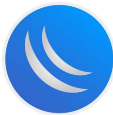
Gambar 2.2 Logo Winbox

Winbox merupakan aplikasi yang dapat mengkonfigurasi mikrotik dengan cepat dan menggunakan tampilan GUI ( graphycal user interface ). Winbox dapat mengkonfigurasi dari sisi server maupun sisi client. Fungsi winbox dapat mempermudah pengguna karena tidak perlu menggunakan sintaks atau kode-kode perintah pada console yang relatif kompleks[8].