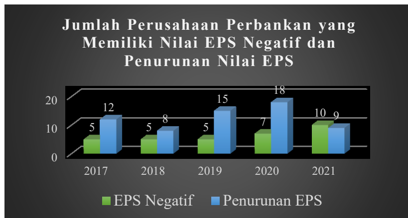
Gambar 1.2 Jumlah Perusahaan Perbankan yang memiliki Nilai EPS Negatif dan Terindikasi Mengalami Financial Distress Selama Tahun 2017-2021