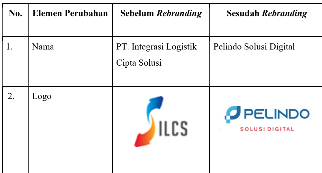
Tabel 1.1 Elemen Perubahan

Dalam menjalankan implementasi rebranding di perusahaan Pelindo Solusi Digital merupakan tanggung jawab dari divisi corporate secretary . Divisi corporate secretary yang juga terhubung langsung dengan holding yang memiliki strategi selama proses rebranding perusahaan berlangsung. Perubahan branding yang terlihat di antara lain adalah perubahan identitas dari PT Integrasi Solusi Digital menjadi Pelindo Solusi Digital. Terdapat perubahan nama perusahaan dan juga perubahan terhadap bentuk logo. Perubahan nama perusahaan dari PT Integrasi Logistik Cipta Solusi menjadi Pelindo Solusi Digital, dan berikut terdapat lampiran perubahan logo dari perusahaan.