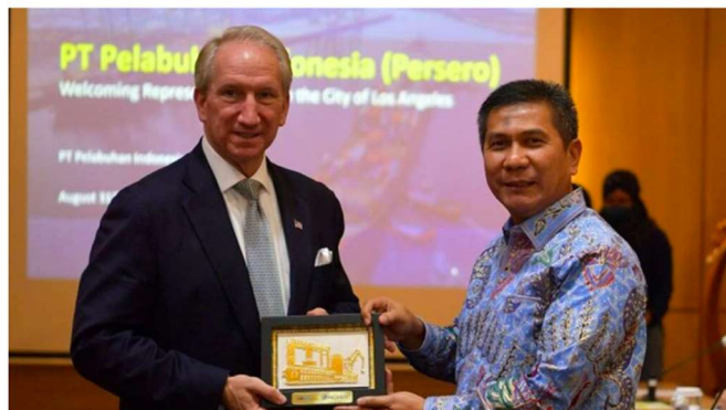
Gambar 2.1 Pengenalan Rebranding Pelindo kepada Komunitas Global oleh Direktur Utama Pelindo

Bersumber dari theshippinggazette.com salah satu media cetak perkapalan di Indonesia, dalam artikelnya yang berjudul “ One Year After Pelindo Merger: Rebranding (Almost) Completed, Transformation a Never Ending Work ” yang dipublikasikan pada 2022 membahas tentang bagaimana tahapan perubahan struktur organisasi yang terjadi setelah adanya merger perusahaan yang dilakukan oleh Pelindo. Pelindo yang awalnya merupakan beberapa perusahaan pelabuhan daerah sekarang berubah menjadi perusahaan nasional yang terintegrasi. Penggabungan tersebut telah mendukung Pelindo pada posisi yang lebih strategis, menjadi pemain nasional dan korporasi yang lebih besar.