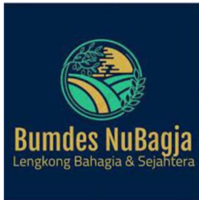
Gambar 1.1 Logo BUMDes Nubagja