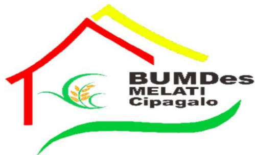
Gambar 1.1 Logo BUMDes Melati Cipagalo