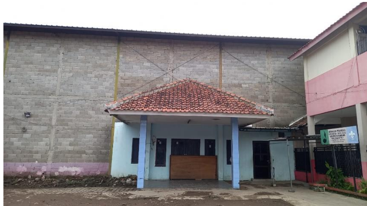
Gambar 1.2 GOR yang dikelola oleh BUMDes Melati Cipagalo