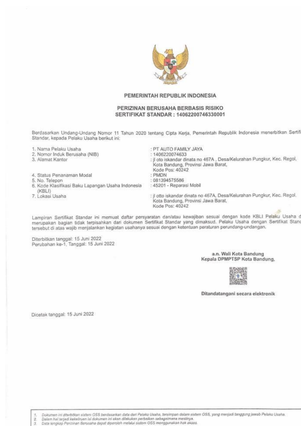
Gambar 1. 3 Bukti Perizinan Berusaha Berbasis Risiko Auto Family Jaya

bengkel reparasi kendaraan roda empat. Bukti bahwa Auto Family Jaya sudah memiliki perizinan usaha dapat dilihat pada gambar berikut.