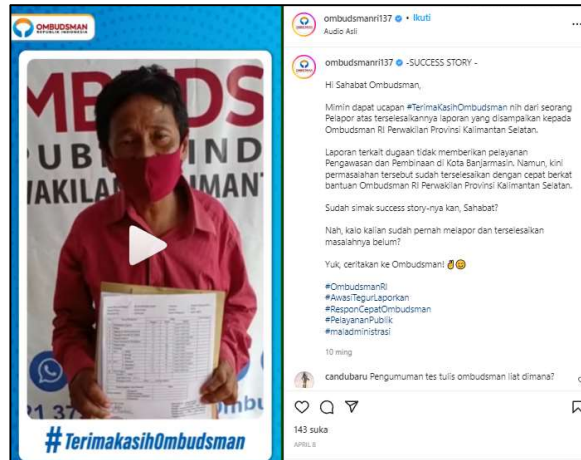
Gambar 1.3 Unggahan Report Penyelesaian Perkara Pengaduan Masyarakat