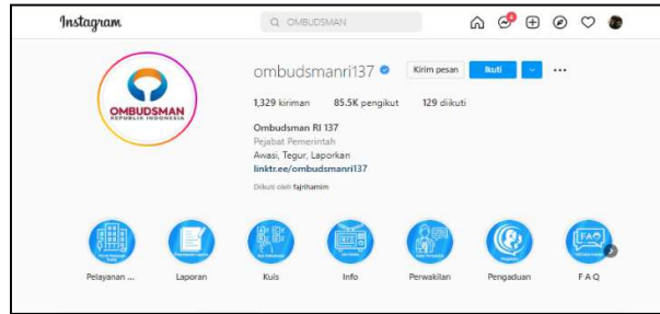
Gambar 1.1 Profil Instagram @ombudsmanri137

Sumber : (Instagram @ombudsmanri137, diakses tanggal 21 Januari 2023 pukul 19.01 WIB)