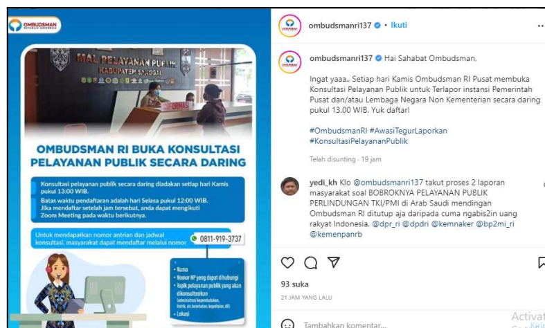
Gambar 1.4 Postingan Informasi Layanan Konsultasi Daring

Juni 2022 dimana akun Instagram @ombudsmanri137 menginfokan bahwa pelayanan bisa dilakukan melalui zoom meeting yang diadakan setiap hari Kamis pukul 13.30. Dalam postingan tersebut juga diinformasikan bahwa batas pendaftaran konsultasi daring adalah hari Selasa pukul 12.00. Selain itu, dicantumkan juga nomor yang bisa dihubungi untuk mendapatkan nomor antrian dan informasi lebih lanjut. Unggahan dari akun Instagram @ombudsmanri137 memberikan informasi-informasi yang up to date tidak sebatas informasi layanan internal tetapi juga membahas isu-isu terkini. Untuk menarik perhatian masyarakat, akun Instagram @ombudsmanri137 juga sering mengadakan kuis-kuis dengan mengangkat isu yang terbaru. Postingan foto, video, dan caption dipublikasikan dengan menarik, kreatif, dan tidak bertele-tele. Beberapa alasan tersebut menjadikan peneliti tertarik untuk mempelajari pemanfaatan Instagram bagi salah satu lembaga pelayanan public dan ilmu yang diberikan oleh Humas Ombudsman RI dapat menjadi sumber belajar baru bagi mahasiswa yang tertarik dengan pengelolaan Instagram sosial oleh lembaga layanan publik.