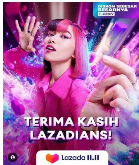
Gambar 1.3 Isyana Sarasvati sebagai Brand Ambassador Lazada

Selebriti adalah seseorang yang terkenal, populer, memiliki kepribadian tertentu dan memiliki reputasi (Yanti dan Gusfa, 2022). Tujuan penggunaan Brand Ambassador sendiri ialah untuk mengkomunikasikan dan menciptakan citra brand yang menguntungkan sehingga mampu meningkatkan citra positif serta daya tarik terhadap brand . Dalam memilih Brand Ambassador tentunya harus memperhatikan aspek popularitas dan representasi karakter produk yang akan diiklankan sehingga pesan yang akan disampaikan tepat dan mampu meningkatkan citra brand yang positif.