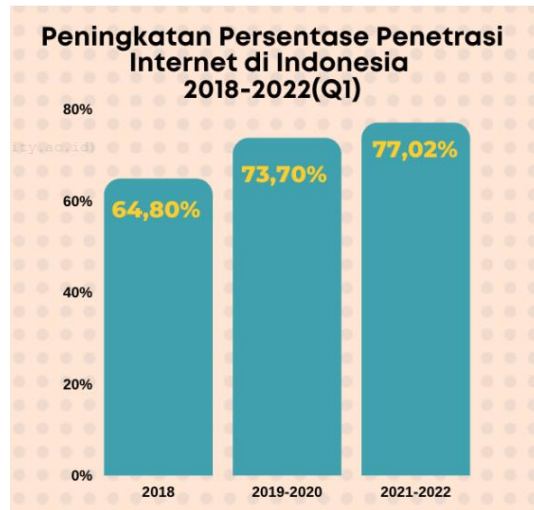
Gambar 1. 1 Tingkat Penetrasi Internet di Indonesia 2018 – 2022 (Q1)