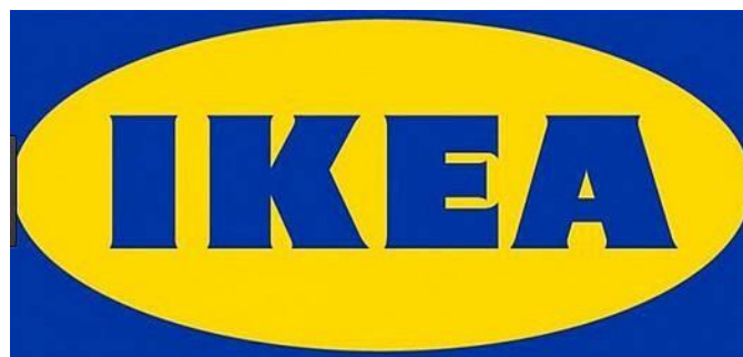
Gambar 1.1 Logo IKEA

Logo yang di miliki IKEA dapat disajikan sebagai berikut :