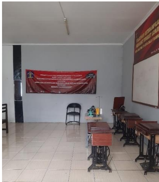
Gambar 1. 3 Ruang menjahit dalam aula LPKA