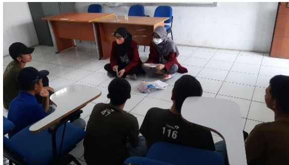
Gambar 1. 5 Wawancara dengan warga binaan anak