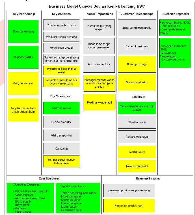
GAMBAR 4 Business Model Canvas Usulan Keripik Kentang BBC

Rancangan Business Model Canvas ini menggunakan data dari analisis SWOT, value proposition canvas , dan fit customer profile with value map untuk melakukan peningkatan dan pemberian usulan pada bisnis model. Hasil rancangan Business Model Canvas setiap bloknya sebagai berikut: