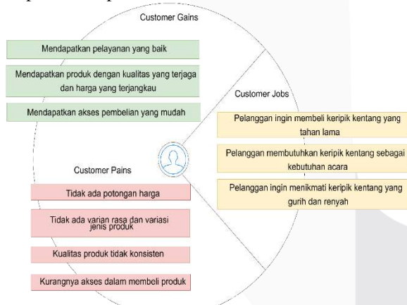
GAMBAR 3 Customer Profile Keripik Kentang BBC

Berdasarkan data pelanggan yang didapatkan dari hasil wawancara, maka didapatkan customer jobs , customer pains , dan customer gains . customer profile dari Keripik Kentang BBC dapat dilihat pada Gambar 3.