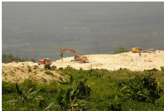
Gambar 1.3 Dokumentasi aktivitas penambangan pabrik semen

Sebagaimana yang telah kita ketahui, menurut Asnawi (2021) bahwa kegiatan yang berhubungan dengan penggunaan sumber daya alam di Indonesia mengalami sejarah buruk mulai dari, kasus kasus lumpur Lapindo PT. Semen Indonesia di Tuban yang mendapat protes dari petani akibat kegiatan operasional mereka menggerus lahan pertanian dan mengakibatkan kehilangan mata pencarian, hingga yang terbaru adanya dokumentasi film Sexy Killer yang sempat viral di media sosial. Menurut VOA (2019) dokumentasi tersebut memperlihatkan bagaimana aspek lingkungan dan aspek sosial yang terdampak oleh industri yang berkaitan dengan penggunaan sumber daya alam secara langsung oleh perusahaan-perusahaan di Indonesia.