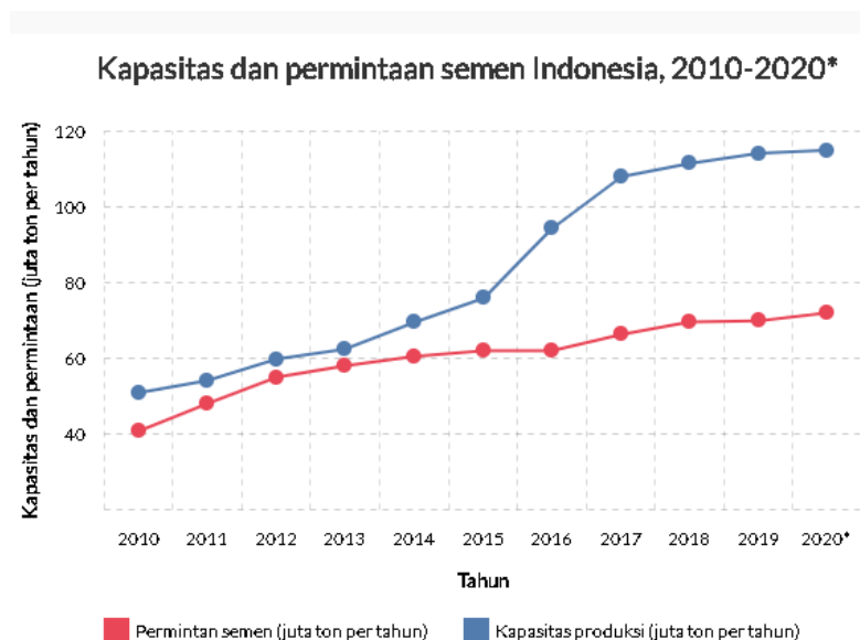
Gambar 1.2 Permintaan dan Kapasitas Industri Semen Indonesia

Perkembangan teknologi dan inovasi dewasa ini menyebabkan terjadinya perkembangan berbagai sektor dan salah satunya adalah sektor ekonomi. Sektor ekonomi tentu erat kaitannya dengan perusahaan dan industri yang bergerak didalamnya. Salah satu sektor industri yang mendapat pengaruh dari perkembangan teknologi adalah industri semen. Perkembangan teknologi pengolahan semen diakui oleh ASI (Asosiasi Semen Indonesia) mampu meningkatkan produksi dan kapasitas serta permintaan pada industri semen sejak 2010.