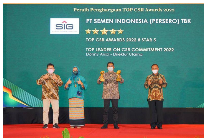
Gambar 1.4 Penghargaan CSR Awards PT. Semen Indonesia

Dari uraian diatas dan dengan fakta mengenai kerusakan yang disebabkan oleh operasional pabrik semen, dapat dilihat bahwa industri semen berpengaruh terhadap lingkungan sekitar pabrik. Sehingga perusahaan membutuhkan kegiatan Corporate Social Responsibility sebagai kompensasi atas kerusakan dan kerugian yang ditimbulkan akibat operasional. CSR sendiri saat ini banyak dilakukan oleh perusahaan semen dimana yang terbaru adalah saat PT. Semen Indonesia mendapatkan penghargaan dibidang CSR . PT. Semen Indonesia telah berhasil mendapatkan penghargaan CSR Award atas prestasi dalam pelaksanaan program CSR yang mereka miliki.