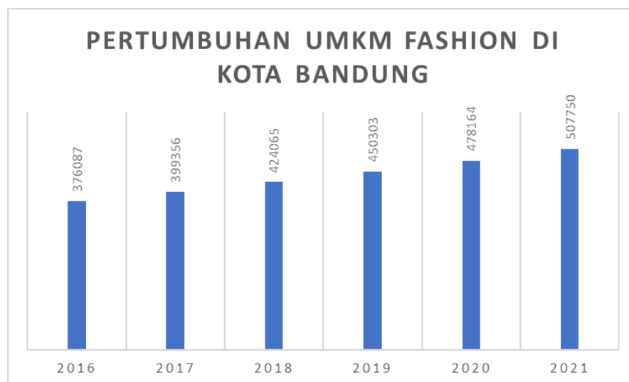
Gambar I.1 Pertumbuhan Usaha Mikro Kecil Menengah (UMKM) Fashion di Kota Bandung Tahun 2016 – Tahun 2021

Pertumbuhan ekonomi di Indonesia didukung oleh meningkatnya keberadaan Usaha Mikro Kecil dan Menengah (UMKM) khususnya di berbagai kota-kota besar. Dilansir dari siaran pers Kementerian Koordinator Bidang Perekonomian Republik Indonesia, kontribusi UMKM di Indonesia terhadap Produk Domestik Bruto (PDB) nasional tercatat mampu mencapai kisaran 61 persen dan mampu menyerap paling banyak tenaga kerja sebesar 97 persen, dibandingkan usaha besar (Kementerian Koordinator Bidang Perekonomian Republik Indonesia, 2022). Berkat pertumbuhan UMKM ini pula peluang pasar di Indonesia dapat terbuka lebar dan membuat para pengusaha serta investor berlomba-lomba bersaing membuat produk baru. Namun, karena pertumbuhan semakin besar, tantangan dalam persaingan juga semakin besar bagi beberapa UMKM, khususnya di kota Bandung yang meningkat hingga 180.000 usaha baru di tahun 2022. Salah satu sektor UMKM yang tengah menunjukkan tingkat persaingan yang tinggi adalah UMKM fashion . Hal tersebut dapat dilihat dari grafik pertumbuhan pada Gambar I.1.