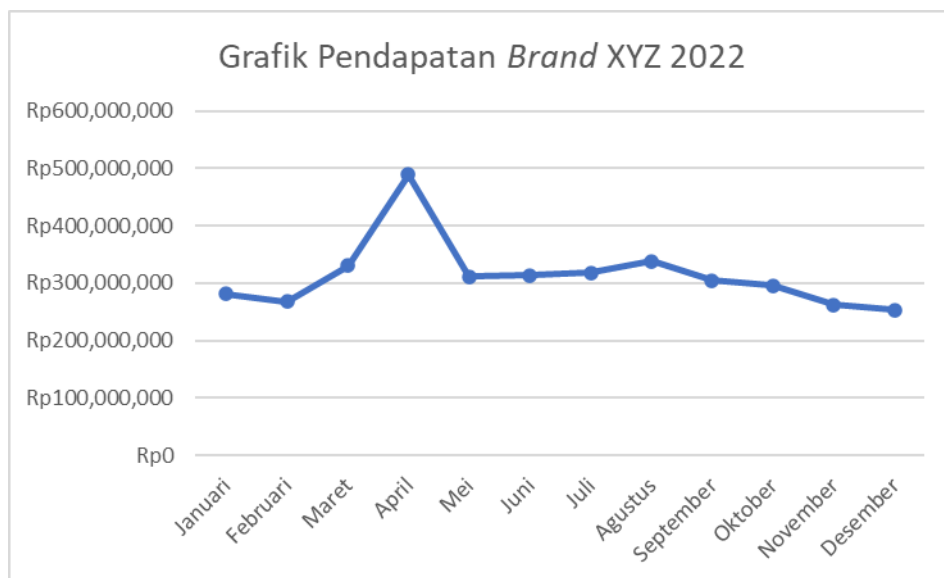
Gambar I.2 Grafik Pendapatan Brand XYZ Tahun 2022

Brand XYZ merupakan UMKM fashion asal Kota Bandung yang berdiri pada tahun 2008 dan mengawali usahanya dengan menjual produk aksesoris handmade hingga berkembang menjadi berbagai jenis produk seperti alas kaki, dompet, tas, pakaian, dan aksesoris. Namun seiring berjalannya waktu, Brand XYZ memfokuskan penjualan pada produk alas kaki seperti sepatu dan sandal, dan berbagai produk yang sudah ada sebelumnya dijual sebagai produk pendampingnya. Sepatu yang diproduksi Brand XYZ memiliki gaya kasual yang ditargetkan untuk wanita dengan rentang usia 18-30 tahun.