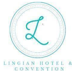
GAMBAR 1.4 Logo Lingian Hotel & Convention

Adapun logo dari Lingian Hotel & Convention adalah sebagai berikut: