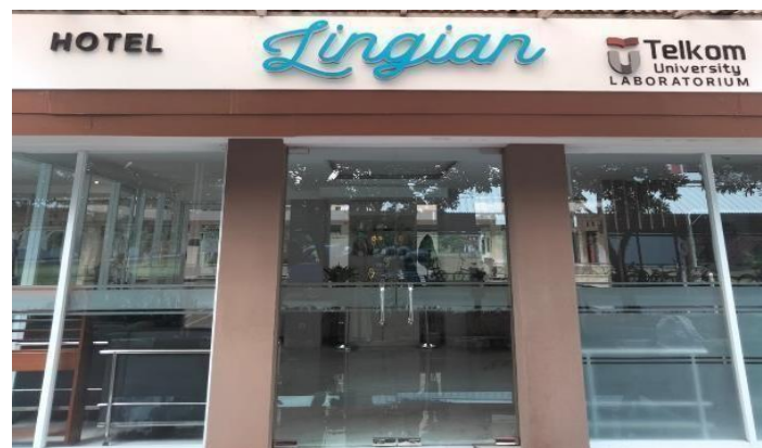
GAMBAR 1.3 Tampilan Lingian Hotel & Convention

Lingian Hotel & Convention merupakan Hotel milik Telkom University, hotel ini merupakan laboratorium praktek untuk mahasiswa Program Studi D3 Perhotelan Fakultas Ilmu Terapan. Lingian Hotel & Convention beradadi Gedung Lingian yang terletak Jl.Telekomunikasi No 1, Bojongsong, Bandung. Lingian Hotel & Convention dapat dicapai dari Kota Bandung dengan berbagai macam transportasi umum seperti, taksi, transportasi online , ataupun pemesanan shuttle dari hotel sendiri.