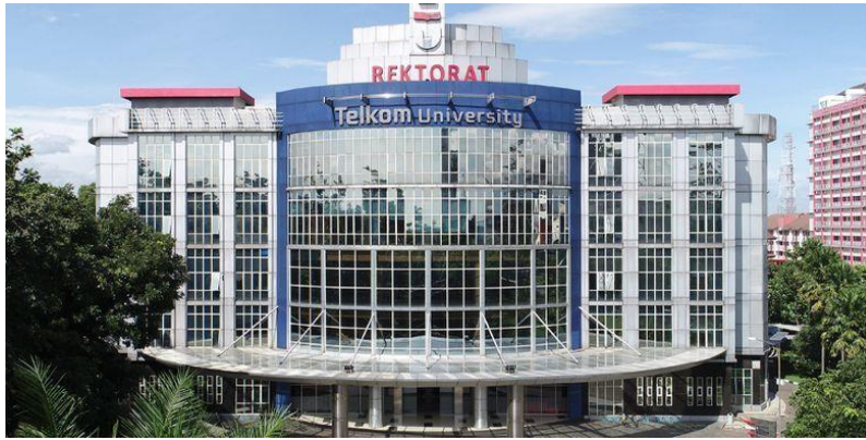
GAMBAR 1.1 Telkom University

Adapun profil dari Fakultas Ilmu Terapan adalah sebagai berikut: