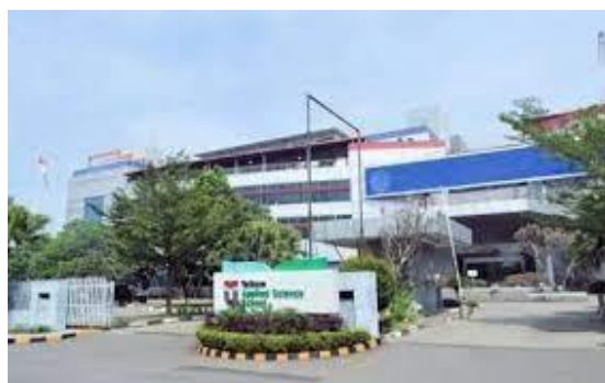
GAMBAR 1.2 Fakultas Ilmu Terapan

Adapun profil dari Fakultas Ilmu Terapan adalah sebagai berikut: