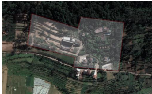
Gambar 1. 1 - Site Plan Bubu Jungle Resort Ciwedeuy

Dalam Perancangan terdapat batasan yang perlu diperhatikan berupa :