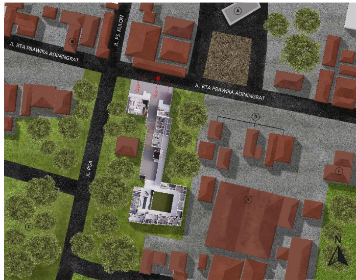
Gambar 1. 1. Site Bangunan

Batasan perancangan pada Klinik Umum Pratama Muaffa meliputi: