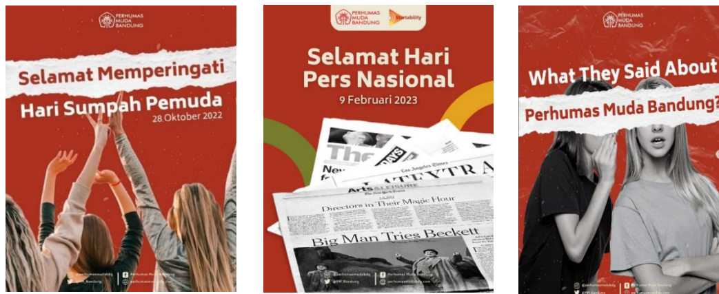
Gambar 1.1 Poster Instagram Perhumas Muda Bandung

Perhumas Muda Bandung adalah sebuah organisasi Humas dan beranggotakan pemuda di Kota Bandung yang menyukai aktivitas kehumasan, Perhumas Muda Bandung menggunakan sebuah sosial media yaitu Instagram sebagai media/ sarana dalam penyampaian sebuah informasinya. Instagram dipilih oleh Perhumas Muda Bandung sebagai sarana penyebaran informasi dikarenakan target Audience Perhumas Muda Bandung ini adalah masyarakat Milenial yang aktif dalam pemakaian media social, dan juga Perhumas Muda Bandung ini memilih Instagram dikarenakan Instagram ini memiliki beberapa Fitur yang unik dan juga bisa menyebarkan sebuah informasi dengan bentuk Visual dan Audio visual. Dalam pembuatan konten Perhumas Muda Bandung ini menggunakan beberapa Ilustrasi agar target audience dari Perhumas Muda Bandung ini tertarik untuk melihat isi dari konten tersebut. Dibawah ini adalah beberapa contoh konten poster yang sudah diunggah pada Instagram Perhumas Muda Bandung.