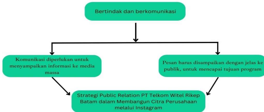
Gambar 4 Model Strategi Humas PT Telkom Witel Rikep Batam (2023)