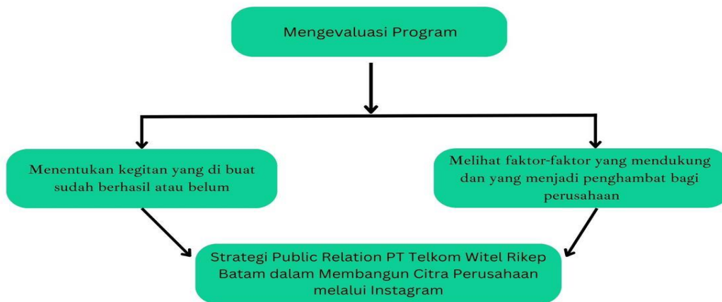
Gambar 5 Model Strategi Humas PT Telkom Witel Rikep Batam

“Tahapan evaluasi dilakukan terutama bagi PT Telkom Witel Rikep Batam untuk melihat apakah program-program yang dibuat oleh General Support dan Consumer Service berhasil atau tidak, salah satu bentuk analisis dari perusahaan PT Telkom Witel Rikep Batam tentang peningkatan pendapatan, citra perusahaan, dan peningkatan jumlah pengikut Instagram @witel_rikep alat strategi Humas dalam membangun citra. PT Telkom Batam melakukan evaluasi” (Ariesta Mirania Febiola, 3 juli 2023).