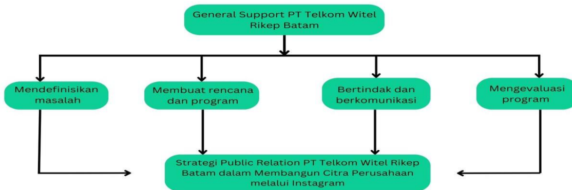
Gambar 6 Model Strategi Humas PT Telkom Witel Rikep Batam

Dari keempat visualisasi diatas yang dibuat oleh peneliti, kemudian peneliti berhasil membuat model gabungan visualisasi. Humas bandung sendiri menggunakan 4 strategi yaitu, Mendefinisikan Masalah, Membuat Rencana dan Program, Bertindak dan Berkomunikasi, dan Mengevaluasi Program. Penyeleksian, strategi Humas dalam membangun citra perusahaan