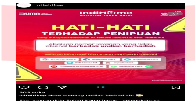
Gambar 1 Adanya penipuan yang mengatas namakan PT Telkom Witel Rikep Batam

Menurut Steinberg yang dikutip oleh Meinanda (2008), kehadiran humas memegang peran penting dalam setiap instansi karena humas merupakan salah satu strategi untuk membangun citra perusahaan. Karena dalam membentuk citra sebuah lembaga, humas biasanya memiliki jangkauan relasi yang luas. Maka dari itu, dalam upaya membangun citra dan mendapat kepercayaan masyarakat, perusahaan harus dapat menjalin relasi dengan media massa, disinilah peran penting bagi seorang humas bukan hanya untuk membangun citra, tapi juga menjalankan hubungan baik dengan media massa dapat membantu perusahaan disaat mendapatkan isu dan krisis mengenai nama baik perusahaan yang menyebabkan menurunnya citra perusahaan. Adanya permasalahan yang terjadi pada PT Telkom Witel Rikep Batam seperti gambar dibawah ini