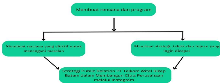
Gambar 3 Model Strategi Humas PT Telkom Witel Rikep Batam