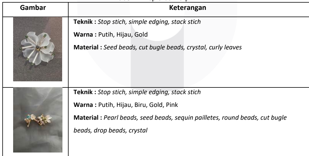
Tabel 2. Eksplorasi Terpilih

Pada tahap pemilihan eksplorasi ini terpilih lima komposisi yang akan diterapkan pada produk tas.