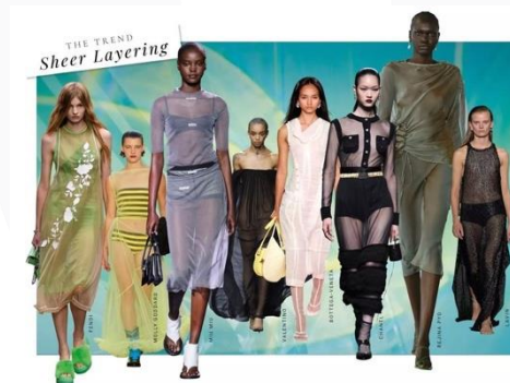
Gambar 2. Trend Sheer Layering Sumber: Marie Claire website, 2022. Diakses pada tanggal 18 November 2022.

Tren Sheer Layering ini adalah musim tembus pandang, karena penampilan tipis dan transparan muncul di seluruh landasan pacu Musim Semi/Musim Panas 2023. Menurut TagWalk, sekitar 77% desainer menyertakan tampilan transparan dalam koleksi mereka, yang semakin memperkuat keunggulan tren tersebut.