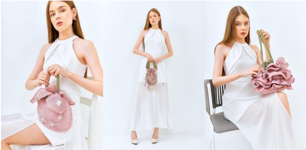
Gambar 4. Visualisasi Produk Sumber : Dokumentasi Pribadi, 2023.