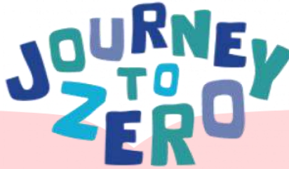
Gambar 1.3 Logo Journey To Zero

(Journey To Zero, 2022). Selain itu kampanye #BirukanLangit merupakan gerakan yang mengajak masyarakat dari berbagai lapisan masyarakat dengan gaya yang akrab melalui tantangan virtual agar menjadi agen perubahan di daerah masing-masing (Kantingan Mentaya Project, 2020). Berawal dari virtual challenge gerakan #Birukan langit kini mulai terintegrasi dengan kegiatan offline .