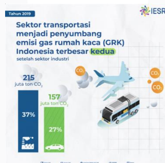
Gambar 1. 2 Sektor Penyumbang Emisi Karbon

Tidak hanya itu, emisi karbon yang dihasilkan kendaraan bermotor juga ikut menyumbang. Tidak hanya itu, emisi karbon yang dihasilkan kendaraan bermotor juga ikut menyumbang. Pada tahun 2019 Indonesia kategori transportasi mengeluarkan emisi sebanyak 157.326 Gg CO2e dengan peningkatan rata-rata sebesar 7,17% per Tahun (Pusat Data dan Teknologi Informasi Energi dan Sumber Daya Mineral Kementerian Energi dan Sumber Daya Mineral, 2020). Kategori transportasi juga menjadi kedua yang terbesar dalam menyumbang emisi karbon menurut Institute for Services Reform (IESR) yang dapat dilihat pada gambar 1.2.