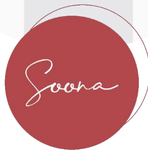
Gambar 1.1 Logo Soonaa

Instagram adalah salah satu platform yang memiliki banyak pengguna dari berbagai kalangan, hal ini dapat dimanfaatkan bagi perusahaan untuk melakukan pemberian informasi atau tips. Soonaa adalah salah satu yang memanfaatkan hal ini dalam melakukan kampanye digital pola hidup sehat pada akun Instagram @soonaofficial.id.