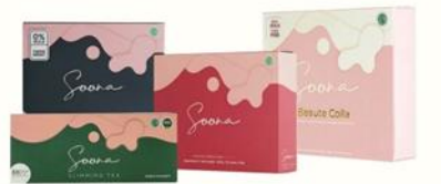
Gambar 1.2 Produk Soona

Produk kesehatan yang diciptakan oleh Soona diharapkan dapat memberikan dampak positif di bidang kesehatan dan kecantikan. Soona memiliki 4 varian produk yang ditawarkan yaitu, Soona Anggur, Soona sayur, Soona sliming tea, dan Soona beauty colla.