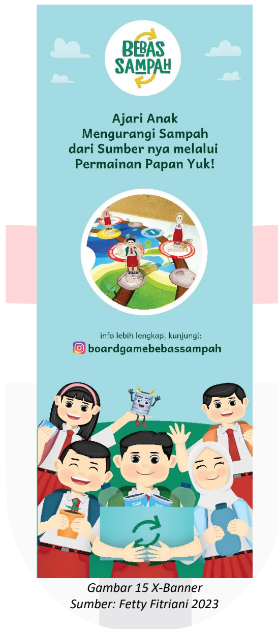
Gambar 15 X-Banner

Jika dilihat dari jauh, X-Banner dapat terlihat dengan jelas dan dapat menarik perhatian pada acara-acara besar.