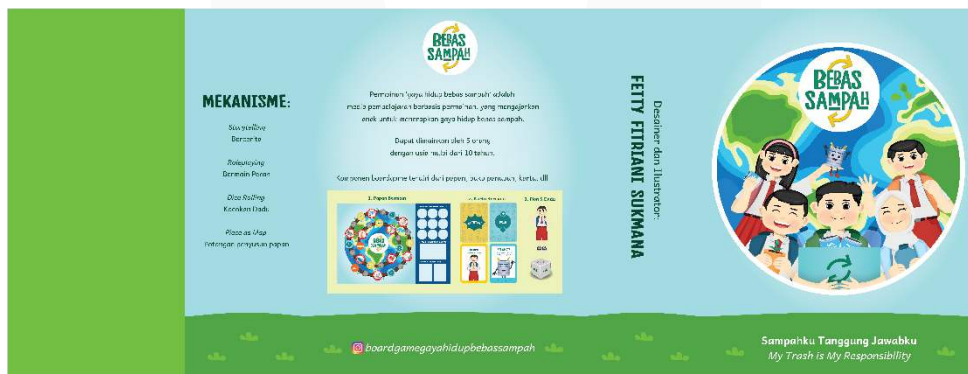
Gambar 11 Packaging bagian luar boardgame

Packaging diatas berupa packaging slide . Didalam nya terdapat bagian-bagian masing-masing yang memuat tiap komponen boardgame .