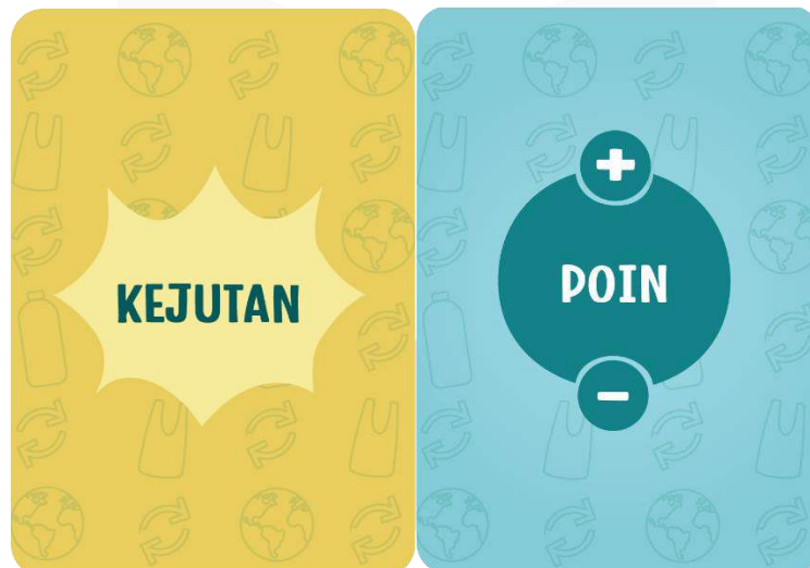
Gambar 6 Kartu Kejutan dan Poin