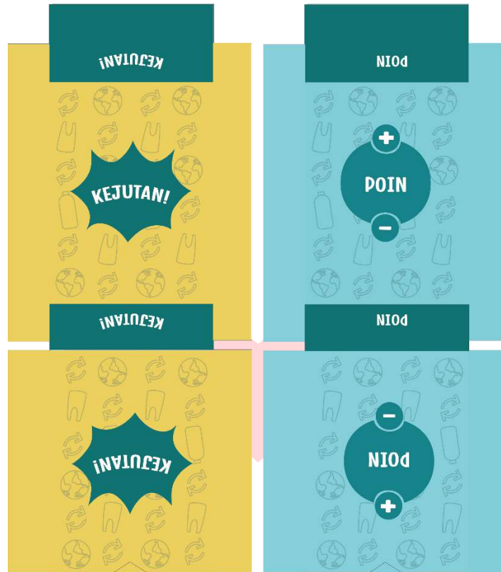
Gambar 12 Packaging kartu

Kartu memiliki packaging tersendiri. Packaging berfungsi sebagai pelindung kartu agar tidak kotor dan hilang. Dibawah ini adalah foto keseluruhan boardgame yang sudah dibuat.