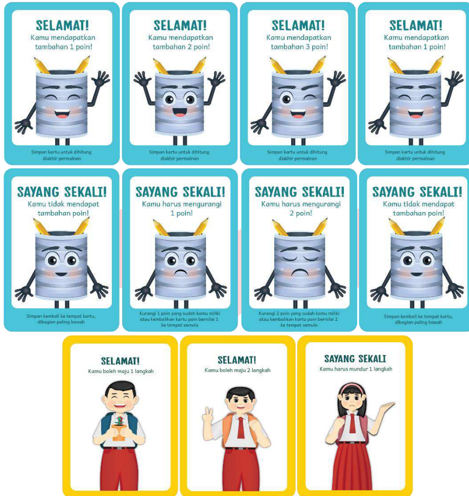
Gambar 7 Kartu Bagian Depan