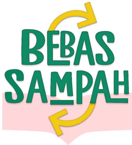
Gambar 1 Logo Bebas Sampah