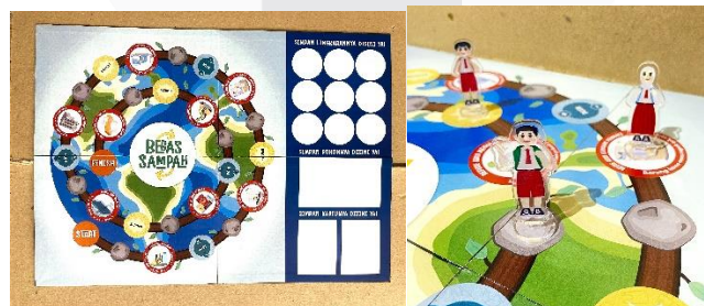
Gambar 13 Boardgame

Kartu memiliki packaging tersendiri. Packaging berfungsi sebagai pelindung kartu agar tidak kotor dan hilang. Dibawah ini adalah foto keseluruhan boardgame yang sudah dibuat.