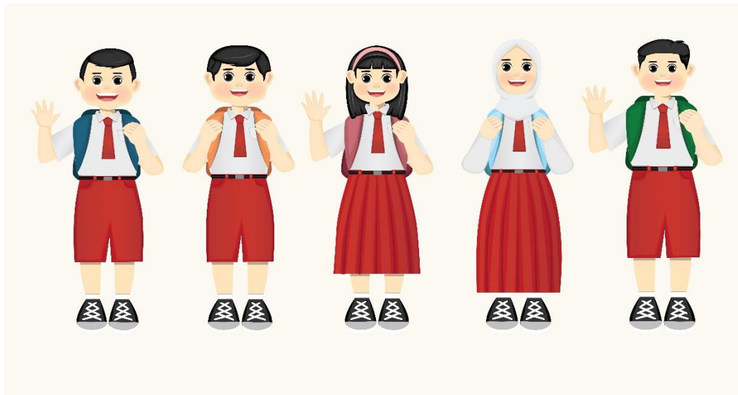
Gambar 2 Ilustrasi Pion Full Body