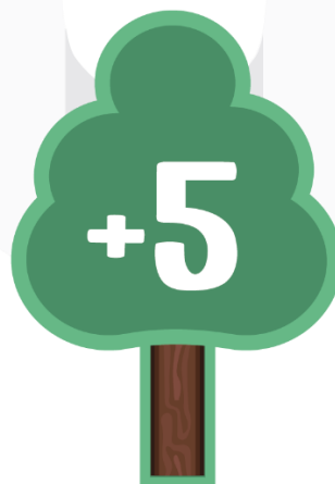
Gambar 9 Pion Reward

Token adalah komponen boardgame yang berfungsi sebagai bagian dari piece of map . Token merah yang merupakan masalah, menyatu dengan board . Sedangkan token berwarna hijau terpisah dari board , disusun secara manual oleh pemain, berdasarkan cerita. Selain Token diatas, terdapat Token tambahan lain yang merupakan reward bagi pemain yang sudah berhasil mengubah token merah menjadi token hijau.