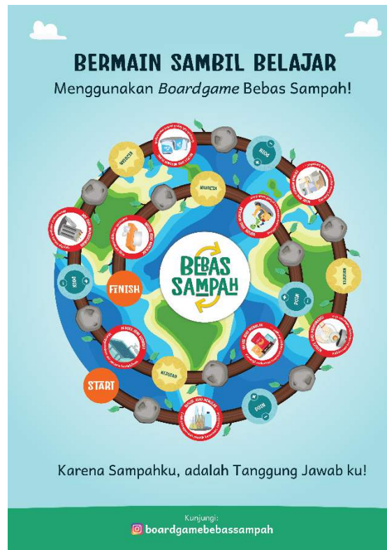
Gambar 14 Poster untuk pameran

Poster menjadi media pendukung jika diadakan pameran di bidang pendidikan.