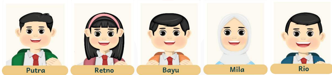
Gambar 3 Pion Wajah Sumber: Fetty Fitriani 2023