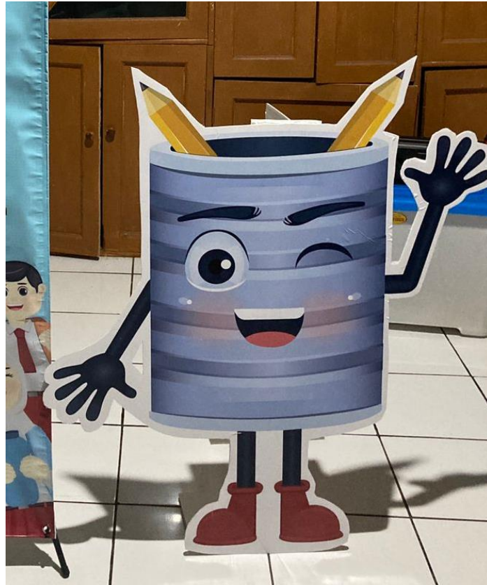
Gambar 16 Standee

Standee dapat disimpan dibagian depan booth agar semakin menarik perhatian.