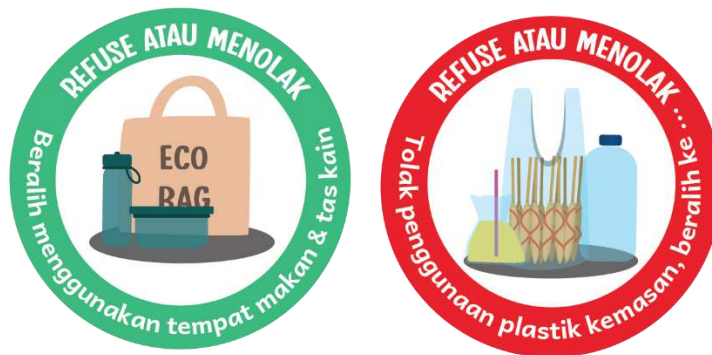
Gambar 8 Token

Token adalah komponen boardgame yang berfungsi sebagai bagian dari piece of map . Token merah yang merupakan masalah, menyatu dengan board . Sedangkan token berwarna hijau terpisah dari board , disusun secara manual oleh pemain, berdasarkan cerita. Selain Token diatas, terdapat Token tambahan lain yang merupakan reward bagi pemain yang sudah berhasil mengubah token merah menjadi token hijau.