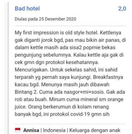
Gambar 1.2 Review Tamu

menemukan serangga pada makanannya dan mengalami diare selama 2 minggu berturut-turut tepat setelah menginap di Hotel Sahid Jaya Lippo Cikarang.