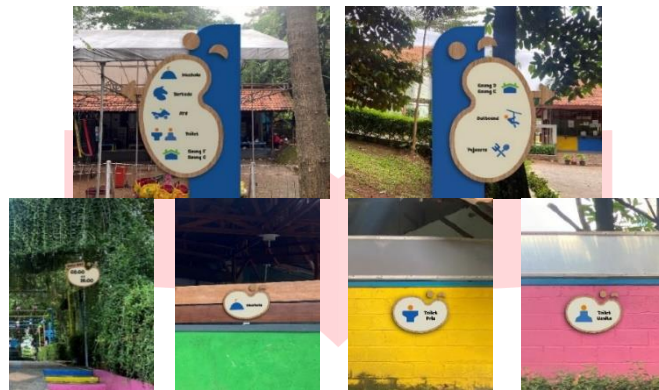
Gambar 11 Pengaplikasian rancangan signage