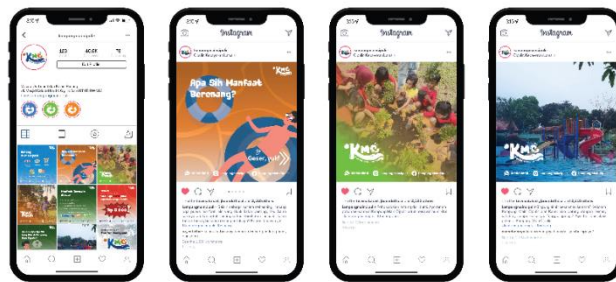
Gambar 16 Sosial Media