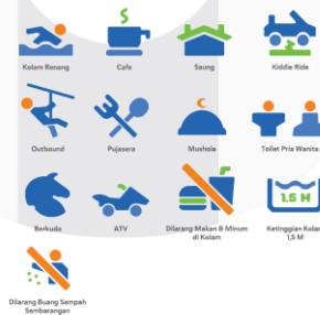
Gambar 3 Hasil Perancangan Pictogram