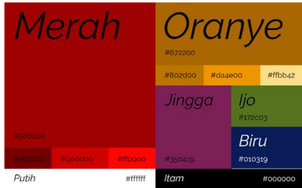
Gambar 2 Color Palette Perancangan