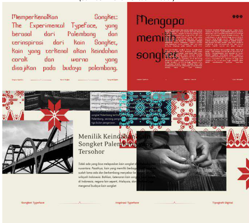
Gambar 6 Contoh Media Pendukung Digital