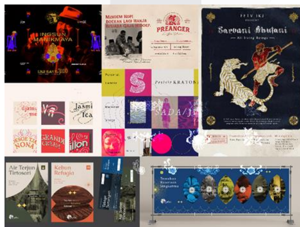
Gambar 1 Inspirasi Look and Feel Perancangan Media

Penggunaan keywords ini membantu untuk filtrasi media dan visual yang diinginkan pada perancangan. Dalam hal ini, media utama akan berpusat pada type specimen book dan media pendukung yang terbagi menjadi media pendukung cetak (Poster, Pamphlet, Sticker Pack) dan digital (post media sosial, diantaranya: Instagram (Feeds, Story, Reels), Behance Post, dan LinkedIn Post). Lalu penentuan visual pun menurun menjadi 3 bagian, yakni (1) Look and Feel, (2) Color System, (3) Type System.