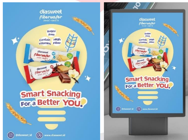
Gambar 3 Poster Produk

Media poster yang mengiklankan produk Diasweet Fiberwafer dengan menggunakan tagline ini akan diletakkan di area-area umum seperti mall, luar café, area olahraga, dan fasilitas umum lainnya dengan tujuan untuk dapat menyebarkan awareness , sekaligus menjadi jembatan bagi target audiens untuk dapat mengunjungi akun Instagram ataupun website Diasweet.