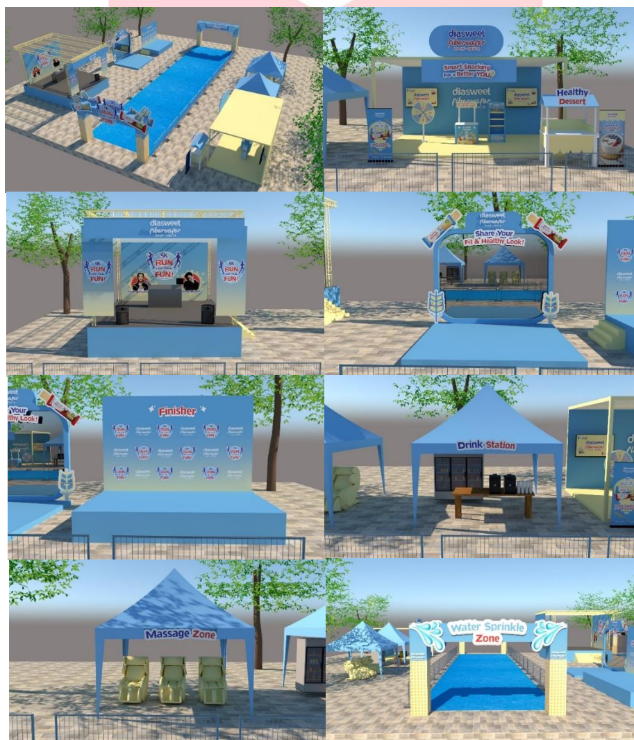
Gambar 13 Event

Media utama pada perancangan ini adalah event olahraga lari bertajuk “Diasweet Fiberwafer: 5K Run for Your Fun!”. Karena pada media event utama ini sangat berpengaruh dalam membangun brand activation antara konsumen dan brand. Pada event ini, tersedia beberapa fasilitas yang dapat dicoba, di antaranya yaitu booth produk, mini game lempar jarum berhadaiah merchandise ataupun produk Diasweet fiberwafer, photobooth, mirror photobooth, drink station, massage zone, water sprinkle, dan stand healthy dessert ala Diasweet Fiberwafer. Selain itu, terdapat panggung hiburan yang akan digunakan untuk penampilan DJ dan guest star saat sharring session .