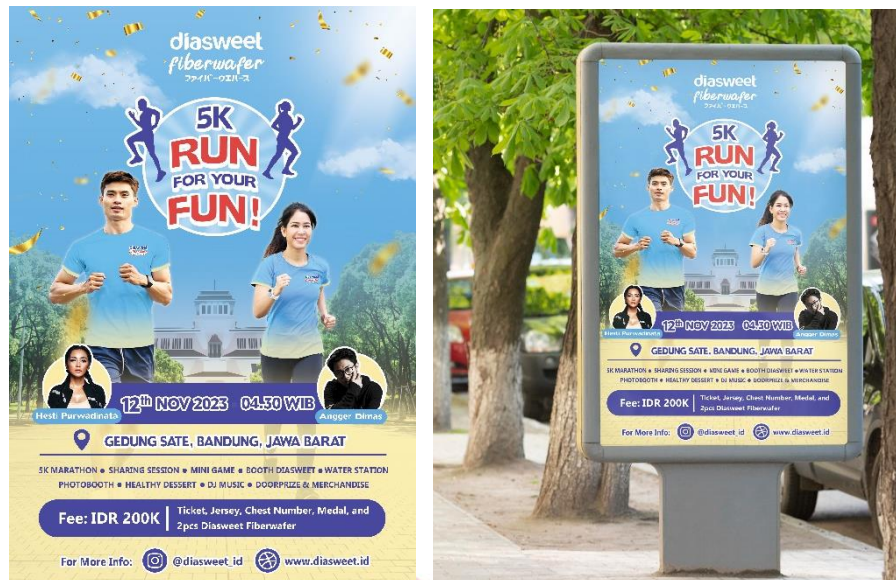
Gambar 4 Poster Produk

Selanjutnya memanfaatkan media billboard sebagai media yang lebih besar dan efektif untuk dapat dilihat oleh masyarakat yang berlalu lalang.