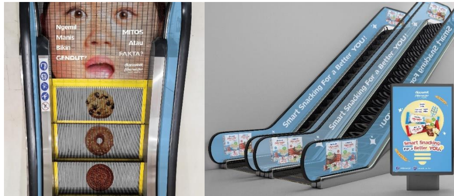
Gambar 6 Ambient Media

Media video teaser berdurasi 51 detik yang berisikan informasi seputar keunggulan produk Diasweet Fiberwafer, akan memanfaatkan media berbayar, yaitu Youtube Ads dengan tujuan agar iklan ini dapat ditonton oleh khalayak luas.