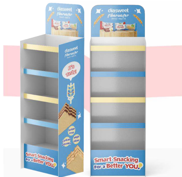
Gambar 8 Standing Display

Point of Purchase berjenis standing display ini akan dipajang di toko/supermarket yang menjual produk Diasweet Fiberwafer. Tujuannya adalah untuk menarik minat membeli dari target audiens yang mengunjungi toko/supermarket tersebut saat mereka melihat pesan visual yang ada di rak display tersebut.