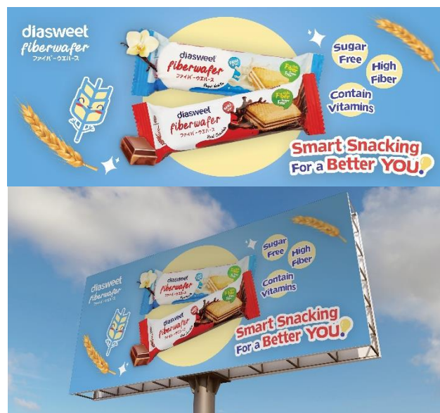
Gambar 5 Billboard

Selanjutnya memanfaatkan media billboard sebagai media yang lebih besar dan efektif untuk dapat dilihat oleh masyarakat yang berlalu lalang.