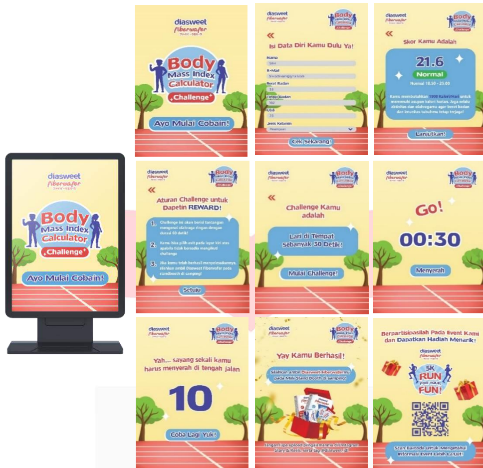
Gambar 11 Interactive Digital

Landing page turut dimanfaatkan sebagai media untuk menyampaikan informasi lengkap seputar event utama yang akan diadakan. Dimana media tersebut juga dapat menjadi jembatan bagi target audiens untuk dapat mengikuti event utama dengan mengisi formulir yang tersedia.