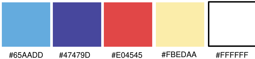
Gambar 2 Warna