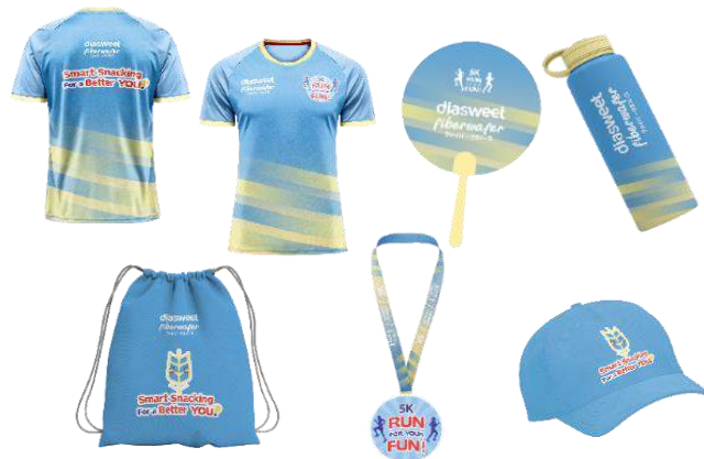
Gambar 14 Merchandise Event

Media yang terakhir adalah filter Instagram. Pada saat periode menjelang event utama yang akan diadakan, terdapat promosi di sosial media yang mengajak target audiens untuk datang ke event dan mendokumentasikan kegiatannya menggunakan filter Instagram untuk kemudian dishare dan mendapatkan hadiah berupa gadget menarik apabila beruntung. Media ini juga dapat menjadi strategi yang efektif untuk dapat membuat target audiens mau membagikan experience seputar event dan produk di sosial medianya, sehingga penyebaran informasi akan berlangsung cepat.