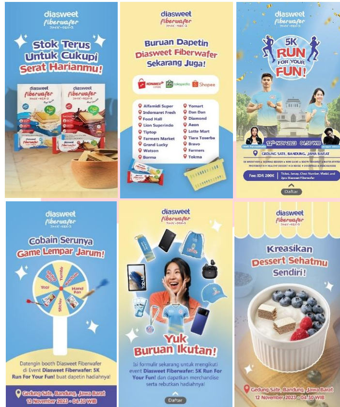
Gambar 10 Sosial Media Stories

Tak hanya melalui fitur postingan, konten promosi juga kerap diposting melalui fitur stories, melihat target audiens yang gemar sekali meliat stories keseharian di sosial media.