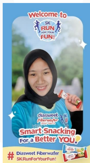
Gambar 15 Instagram Filter

Media yang terakhir adalah filter Instagram. Pada saat periode menjelang event utama yang akan diadakan, terdapat promosi di sosial media yang mengajak target audiens untuk datang ke event dan mendokumentasikan kegiatannya menggunakan filter Instagram untuk kemudian dishare dan mendapatkan hadiah berupa gadget menarik apabila beruntung. Media ini juga dapat menjadi strategi yang efektif untuk dapat membuat target audiens mau membagikan experience seputar event dan produk di sosial medianya, sehingga penyebaran informasi akan berlangsung cepat.