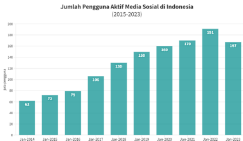
Gambar 2. Jumlah Pengguna Aktif Media Sosial di Indonesia

Media sosial adalah suatu platform, dimana para penggunanya bisa dengan mudah berpartisipasi, berbagi, dan menciptakan isi forum, aspirasi masyarakat, dunia virtual dan sebagainya. Media sosial merujuk pada platform-platform digital yang memungkinkan pengguna untuk berinteraksi, berbagi konten, dan terhubung dengan orang lain secara online [1]. Dalam media sosial juga dapat menjadi tempat untuk menganalisis berita, dimana masyarakat dapat mengetahui setiap isu yang sedang diperbincangkan melalui media sosial. Seiring bertambahnya waktu, pengguna media sosial juga meningkat dibuktikan pada Gambar 2.