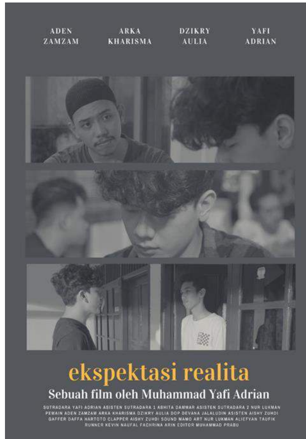
Gambar 1 Poster Karya Film Karya: Muhammad Yafi Adrian Media : Video Judul: Ekspektasi Realita

https://drive.google.com/file/d/1YhkxukjaqcjKE4n8GmqfMjnLf9SNR6N8/view?usp=sharing