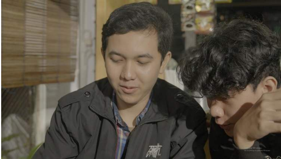
Gambar 2 Cuplikan tertarik bermain judi online

Permasalahan umum yang sering muncul meliputi kehilangan benda berharga dan uang, terperangkap dalam hutang pinjaman online, serta mengalami isolasi dari keluarga seperti yang ditunjukkan pada (Gambar 3), dan juga dari teman, seperti yang diperlihatkan pada (Gambar 4).