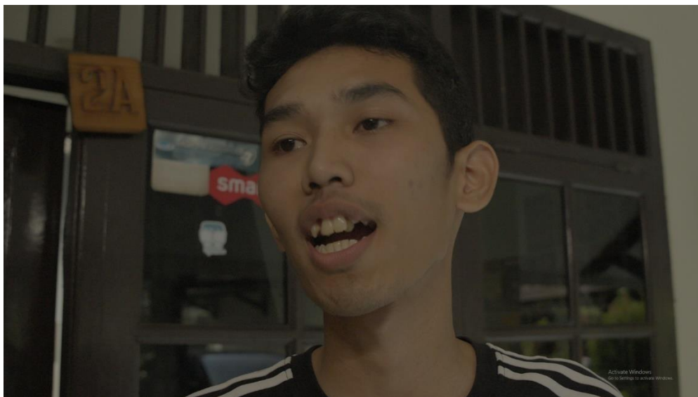
Gambar 3 Konflik terjadi dengan kakak

Permasalahan umum yang sering muncul meliputi kehilangan benda berharga dan uang, terperangkap dalam hutang pinjaman online, serta mengalami isolasi dari keluarga seperti yang ditunjukkan pada (Gambar 3), dan juga dari teman, seperti yang diperlihatkan pada (Gambar 4).