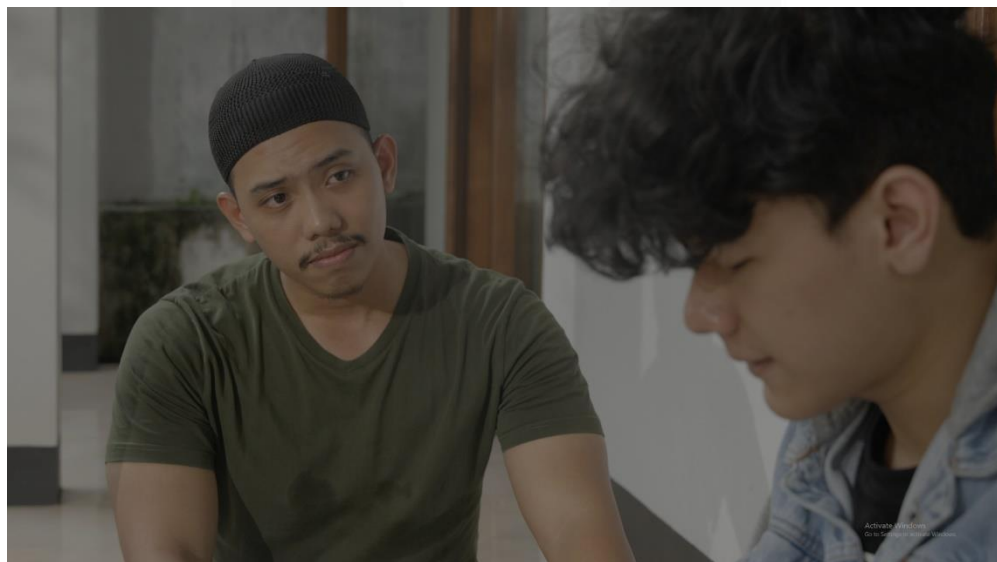
Gambar 5 Bertemu dengan seorang marbot masjid

Kembali pada jalur yang benar melalui (Gambar 5) adalah salah satu cara untuk mengatasi permasalahan perjudian. Seorang penjudi mungkin sudah tidak dapat lagi mencari pertolongan dari manusia, sehingga hanya Tuhan yang dapat memberikan bantuan.