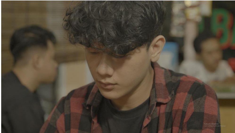
Gambar 4 Cuplikan konflik disebabkan bermain judi online

Kembali pada jalur yang benar melalui (Gambar 5) adalah salah satu cara untuk mengatasi permasalahan perjudian. Seorang penjudi mungkin sudah tidak dapat lagi mencari pertolongan dari manusia, sehingga hanya Tuhan yang dapat memberikan bantuan.