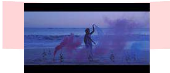
Gambar 13 Scene 5

Pada Scene 4 , terdapat seni pertunjukkan surealisme, dari proses berkarya melukis cat oil di kanvas menggambarkan tentang dirinya. TV analog yang menayangkan monolog ajakan untuk menjadi karakter yang positif, aktor tenggelam ke dalam lautan yang artinya masuk ke dalam mimpi dan terbangun lagi, berdamai dengan diri sendiri bangun dari kenyataan.