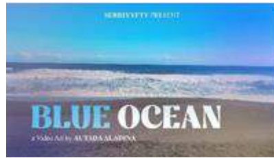
Gambar 8 Karya Seni Video “Blue Ocean” (sumber: dokumentasi pribadi (2023))

Seni video karya Autada Aladina berjudul “Blue Ocean” ini dibuat pada tahun 2023, memvisualisasikan self healing dampak dari traumatik melalui karya seni video, alurnya menggunakan berbagai suasana dan emosi. karya seni video menjadi medium yang digunakan untuk mempermudah interaksi seniman dan audiens . Audio yang dibuat kesan masuk ke dalam alur, mengajak berimajinasi dengan mengekspresikan diri melalui karya. di dalamnya terdapat seni pertunjukkan, mulai dari melukis, monolog, narasi, dan puisi.