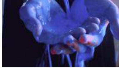
Gambar 12 Scene 4

Pada Scene 4 , terdapat seni pertunjukkan surealisme, dari proses berkarya melukis cat oil di kanvas menggambarkan tentang dirinya. TV analog yang menayangkan monolog ajakan untuk menjadi karakter yang positif, aktor tenggelam ke dalam lautan yang artinya masuk ke dalam mimpi dan terbangun lagi, berdamai dengan diri sendiri bangun dari kenyataan.