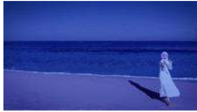
Gambar 9 Scene 1 (sumber: dokumentasi pribadi (2023))

Pada Scene 1 , ombak laut menjadi latar, tokoh wanita menjadi objek utama. aktor mengajak audiens untuk self healing , ketika dunia menutup mata, pergi ke lautan, dan sampaikanlah bahwa ini nyata. Jika masalah terjadi karena adanya sebab dan akibat, maka manusia bisa berubah karena tujuan yang tidak mudah dicapai, terdapat bulan bermakna kesucian artinya self healing membutuhkan ketenangan jiwa dan bersih.