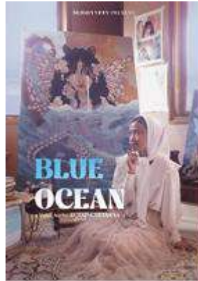
Gambar 6 Poster 3 Blue Ocean

Dengan mulai berdamai dengan diri sendiri lewat self healing dan mengetahui tentang diri ini, mulai dari hobi sampai harapan hidup menjadi poin penting dalam membuat karakter apa yang diinginkan. dengan berimajinasi setinggi mungkin, mampu menciptakan suatu karya yang bermanfaat dengan segala proses yang dilalui, karena suatu hasil akan terlihat jika bersungguh-sungguh menjalankan apa yang diinginkannya, karena blue ocean memiliki makna kedamaian, ketenangan, dan kebenaran.