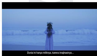
Gambar 11 Scene 3

Pada Scene 2 , menggambarkan traumatik emosional yaitu emosi bahagia, emosi sedih, emosi jijik, emosi marah, emosi takut, dan emosi terkejut. self healing dituntut untuk bagaimana diri mencoba untuk mengenali diri sendiri dengan cara mengekspresikan diri, berbagai emosi yang diperagakan aktor merupakan gambaran bagaimana cara emosi tersebut terbentuk.