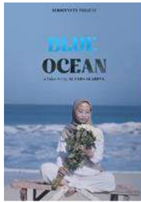
Gambar 4 Poster 1 traumatik (sumber: dokumentasi pribadi (2023))

Poster 1 tentang traumatik yaitu bagaimana perjalanan kehidupan, Ketika merasa banyak tekanan, akhirnya memutuskan untuk keluar dari pola pikir yang bisa membuat diri ini tidak bebas dan penuh dengan tekanan. maka dari itu keputusan tepat adalah dengan cara mulai bisa bermimpi untuk menjadi lebih baik lagi dari sebelumnya, bunga mawar melambangkan kedamaian, yaitu berdamai dengan diri sendiri.