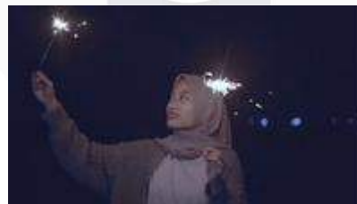
Gambar 14 Scene 6

Pada Scene 5 , Batik parang adalah simbol dari gelombang laut, motif batik parang secara filosofis merupakan tidak pantang menyerah, saling terkait, bermakna perjuangan tidak pernah putus. terdapat seni pertunjukkan puisi dengan tarian yang menggambarkan self healing , tujuannya menjelaskan kenapa harus self healing , mencari makna akan arti kebebasan yang sesungguhnya adalah mencintai diri sendiri.