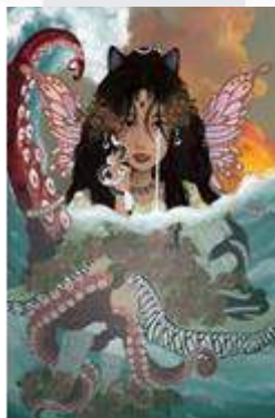
Gambar 2 Prototype digital art

Sketsa lukis surealisme dibuat menggunakan kertas ukuran A3 dengan arsiran pensil, memiliki simbol dan makna, terdiri dari: Wanita yaitu Autada Aladina; Bulan yaitu Kesucian; Awan yaitu Mimpi, khayalan, nyata; Gelombang laut yaitu blue ocean ; Batik parang yaitu Makna gelombang laut; Kupu-kupu (aurora) yaitu Jiwa yang hidup dan mati, perjalanan, perjuangan, kebebasan, tentang perasaan kehidupan; Kucing yaitu Mencintai diri sendiri; Bunga mawar yaitu Makna kehidupan jati diri sesungguhnya; Warna biru yaitu Kepercayaan, loyalitas, tanggung jawab, keamanan. Merasa tenang, merasa dilindungi (+), Kesedihan emosional (-); (titik koma) yaitu Kesehatan mental harapan tentang hidup, membuat diri yang awalnya negatif untuk menuju perubahan yang lebih positif; Ular (Mitologi Yunani) yaitu pemandu hidup mengajari kita perjalanan saat mereka membimbing ke arah yang benar; Gurita (Hewan Roh) yaitu Totem (emosi, kecerdasan, logika, fleksibilitas, potensi, dan kreativitas), gurita sebagai simbol dalam mimpi.