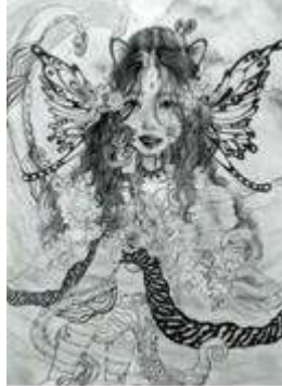
Gambar 1 Sketsa

Sketsa lukis surealisme dibuat menggunakan kertas ukuran A3 dengan arsiran pensil, memiliki simbol dan makna, terdiri dari: Wanita yaitu Autada Aladina; Bulan yaitu Kesucian; Awan yaitu Mimpi, khayalan, nyata; Gelombang laut yaitu blue ocean ; Batik parang yaitu Makna gelombang laut; Kupu-kupu (aurora) yaitu Jiwa yang hidup dan mati, perjalanan, perjuangan, kebebasan, tentang perasaan kehidupan; Kucing yaitu Mencintai diri sendiri; Bunga mawar yaitu Makna kehidupan jati diri sesungguhnya; Warna biru yaitu Kepercayaan, loyalitas, tanggung jawab, keamanan. Merasa tenang, merasa dilindungi (+), Kesedihan emosional (-); (titik koma) yaitu Kesehatan mental harapan tentang hidup, membuat diri yang awalnya negatif untuk menuju perubahan yang lebih positif; Ular (Mitologi Yunani) yaitu pemandu hidup mengajari kita perjalanan saat mereka membimbing ke arah yang benar; Gurita (Hewan Roh) yaitu Totem (emosi, kecerdasan, logika, fleksibilitas, potensi, dan kreativitas), gurita sebagai simbol dalam mimpi.