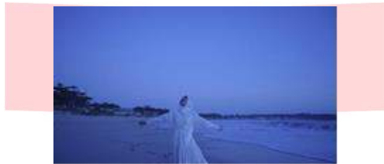
Gambar 10. Scene 2

Pada Scene 1 , ombak laut menjadi latar, tokoh wanita menjadi objek utama. aktor mengajak audiens untuk self healing , ketika dunia menutup mata, pergi ke lautan, dan sampaikanlah bahwa ini nyata. Jika masalah terjadi karena adanya sebab dan akibat, maka manusia bisa berubah karena tujuan yang tidak mudah dicapai, terdapat bulan bermakna kesucian artinya self healing membutuhkan ketenangan jiwa dan bersih.