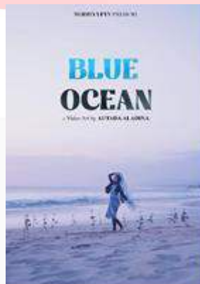
Gambar 5 Poster 2 self healing

Poster 1 tentang traumatik yaitu bagaimana perjalanan kehidupan, Ketika merasa banyak tekanan, akhirnya memutuskan untuk keluar dari pola pikir yang bisa membuat diri ini tidak bebas dan penuh dengan tekanan. maka dari itu keputusan tepat adalah dengan cara mulai bisa bermimpi untuk menjadi lebih baik lagi dari sebelumnya, bunga mawar melambangkan kedamaian, yaitu berdamai dengan diri sendiri.