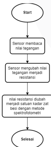
Gambar 3. 1 Flowchart