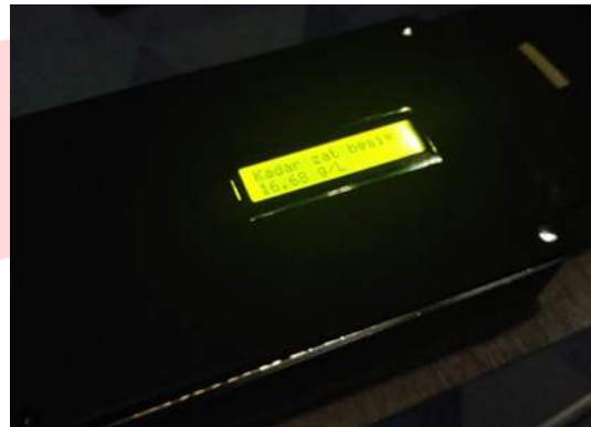
GAMBAR 4. 1

Pengujian yang dilakukan yaitu mendeteksi jumlah kadar zat besi yang terdapat pada larutan didalam botol sampel dengan menggunakan metode spektrofotometri.