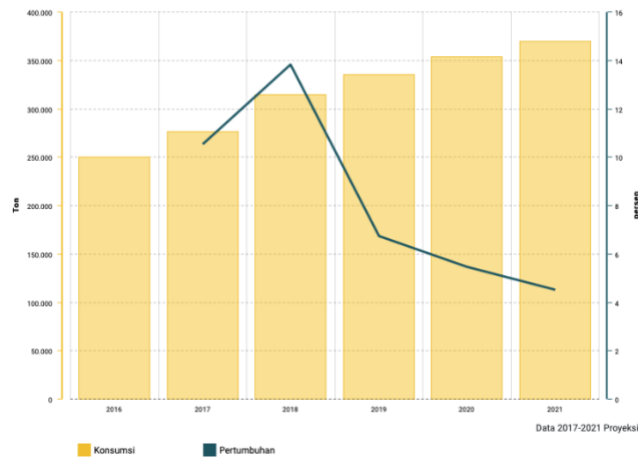
Gambar 1. 2 Data Pertumbuhan Peminum Konsumsi Kopi di Indonesia

Dikutip dari Badan Pusat Statistik, sektor kuliner selalu mengalami pertumbuhan yang melebihi PDB skop nasional. Bahkan laporan menunjukkan bila PDB kuliah tumbuh dengan persentase 9,46% di triwulan III pada 2017, berbeda halnya dengan ekonomi Indonesia yang menyumbang besaran 5,06%. Salah satu bidang kuliner yang kerap dijumpai dewasa ini adalah bisnis kopi. Hal itu terbukti seiring juga dengan bertambahnya masyarakat yang menaruh kecintaannya pada konsumsi kopi di negara Indonesia. Menurut Kementerian Pertanian, tahun 2021 diprediksi pertumbuhan peminum kopi di Indonesia meningkat hingga 370ribu ton, meningkat dari tahun tahun sebelumnya.