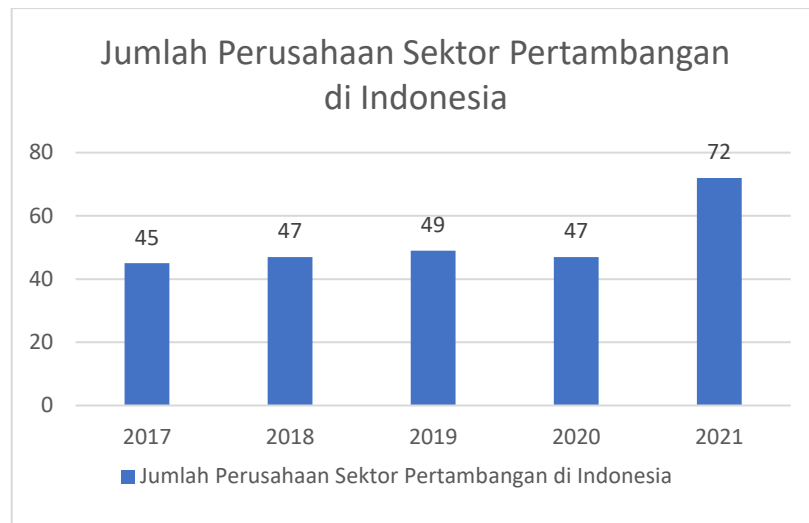
Gambar 1.1 Jumlah Perusahaan Sektor Pertambangan di Indonesia