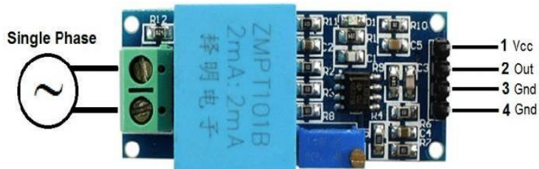
Gambar 2.4 Sensor ZMPT101B

Sensor Tegangan ZMPT101B adalah sensor transformator bertegangan yang dengan sederhana menekan arus listrik dan menyediakan keluaran analog bagi pengguna. Hal ini juga menyediakan isolasi tegangan sampai 4000V dan tegangan operasi aman dari 1000V