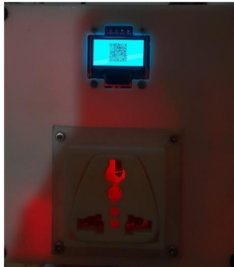
Gambar 2.1 Stop Kontak Pintar

Stop kontak adalah sebuah perangkat instalasi listrik yang memiliki dua atau tiga pin dengan bahan logam yang memiliki fungsi sebagai penghubung antara sumber listrik utama dengan alat listrik lainnya. Seiring dengan berkembangnya zaman mulai muncul istilah smart plug atau stop kontak pintar. Smart plug ( stop kontak pintar ) sendiri adalah sebuah perangkat berbasis Wi-Fi yang bisa dikendalikan melalui jaringan data/jaringan komunikasi dan Qr Code . Beberapa manfaat dari Stop Kontak pintar termasuk memungkinkan otomatisasi rumah dan membuat peralatan biasa dan elektronik konsumen menjadi lebih terkontrol . Kita dapat menggunakan stop kontak pintar untuk mengontrol peralatan kecil seperti lampu dan kipas angin, charger handphone , hair dryer , dan catokan. Dengan stop kontak pintar, kita dapat mengontrol peralatan rumah supaya lebih hemat .