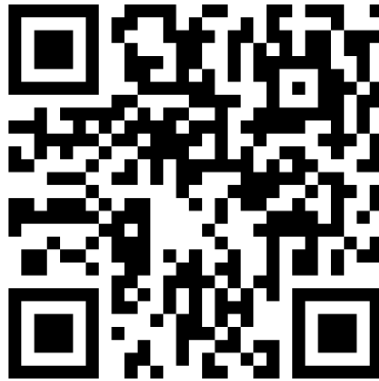
Gambar 2.2 QR Code

diatur dalam bentuk kisi-kisi persegi di atas latar belakang putih. Informasi dienkripsi dalam bentuk data biner, yang dapat mewakili berbagai jenis data, seperti teks, URL, informasi kontak, nomor telepon, alamat email, dan lain-lain