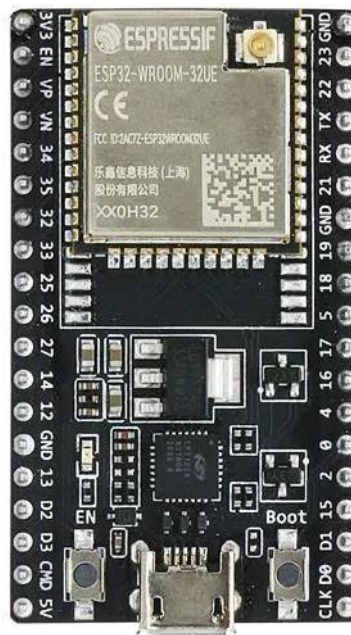
Gambar 2.3 ESP32

ESP32 adalah modul mikrokontroler yang populer dan serbaguna yang dirancang oleh Espressif Systems. Modul ini merupakan bagian dari seri produk ESP ( Espressif Systems' Product ) dan merupakan penerus dari mikrokontroler ESP8266. Modul ESP32 banyak digunakan dalam berbagai proyek elektronik dan Internet of Things (IoT) karena fitur-fitur andal dan harga yang terjangkau.