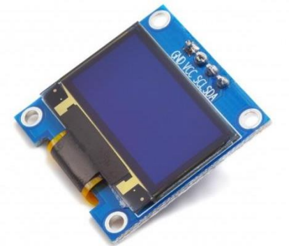
Gambar 2.7 OLED

OLED adalah singkatan dari " Organic Light Emitting Diode " Ini adalah jenis teknologi tampilan yang menawarkan beberapa keunggulan dibandingkan dengan tampilan LCD ( Liquid Crystal Display ) tradisional dan tampilan LED ( Light Emitting Diode ). OLED digunakan dalam berbagai perangkat elektronik, termasuk smartphone, televisi, perangkat wearable, dan lainnya.