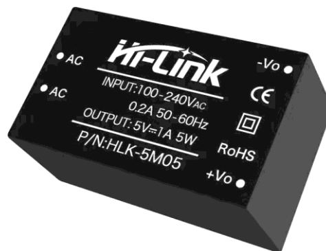
Gambar 2.6 Hi-Link HLK-5M05