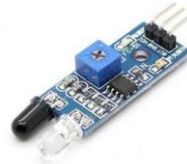
Gambar 2. 4 Infrared Proximity Sensor

Infrared (IR) proximity sensor adalah sebuah komponen elektronika yang berfungsi mendeteksi objek yang memasuki ruang lingkup cahaya inframerah komponen tersebut. Pada Gambar 2.5, led hitam berfungsi sebagai detektor objek dan led putih berfungsi sebagai pemberi informasi bahwa ada objek yang terdeteksi.