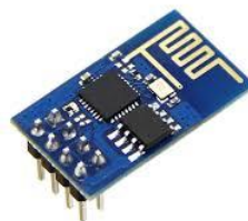
Gambar 2.2 Modul wifi Esp8266

ESP8266 merupakan modul wifi yang digunakan untuk menghubungkan Arduino yang belum dibekali fitur wifi ke jaringan internet dengan membuat koneksi TCP/IP. Karena fitur yang dimiliki sudah mendekati mikrokontroler, maka modul ini dapat beroperasi sendiri tanpa menggunakan mikrokontroler apapun. Contoh modul wifi ESP8266 seperti gambar 2.3 di bawah ini: