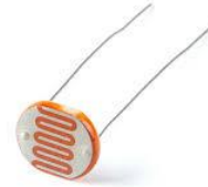
Gambar 2. 3 Light Dependent Resistor (LDR)

Light Dependent Resistor (LDR) merupakan salah satu komponen sensor yang berfungsi untuk menerima intensitas cahaya dalam meneruskan arus listrik. Komponen LDR seperti Gambar 2.4 ini memanfaatkan jumlah intensitas cahaya dalam menghambat arus listrik yang masuk. Jika cahaya yang diterima kurang dari nilai yang telah ditentukan, maka arus listrik akan berhenti atau tidak diteruskan.