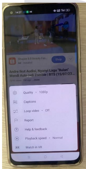
GAMBAR 4 Pengujian Streaming YouTube

Pada proses Pengujian dilakukan dengan pemilihan video acak. Resolusi yang digunakan adalah resolusi tertinggi yang ada pada video tersebut yaitu 1080p60 HD. Hasil pengujian dapat dilihat pada tabel 8.