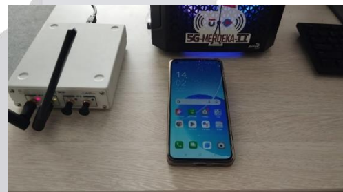
Pengujian pada saat Idle