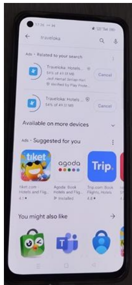
GAMBAR 3 Pengujian Download Aplikasi

Traveloka. Setelah selesai mengunduh aplikasi tersebut dilakukan perhitungan untuk mendapatkan Quality of Service. Dan didapatkan hasil seperti tabel 7.