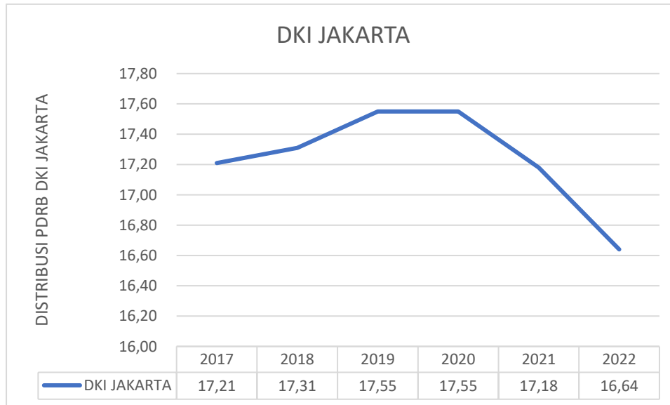
Gambar 1.1 Distribusi PDRB Terhadap Jumlah PDRB di Indonesia Atas Dasar Harga Berlaku di DKI Jakarta (Persen)

Berdasarkan gambar 1.1 di atas menunjukkan bahwa jumlah kontribusi PDRB provinsi DKI Jakarta atas harga berlaku di Indonesia, DKI Jakarta sebagai penyumbang Distribusi PDRB terbesar di Indonesia dari tahun 2017 s.d tahun 2022. Pada tahun 2017 DKI Jakarta menyumbang PDRB sebesar 17,21% dari total PDRB di Indonesia, pada tahun 2018 mengalami kenaikan sebesar 0,10% menjadi 17,31% dari total distribusi di Indonesia, pada tahun 2019 dan tahun 2020 distribusi PDRB DKI Jakarta mengalami kenaikan pada tahun 2019 sebesar 0,24% menjadi 17,55% dari total PDRB di Indonesia, sama halnya dengan tahun 2020 menyumbang distribusi PDRB sebesar 17,55%. Pada tahun 2021 distribusi PDRB DKI Jakarta mengalami penurunan sebesar 0,37% menjadi sebesar 17,18% dari total distribusi PDRB di Indonesia, terakhir pada tahun 2022 distribusi PDRB DKI Jakarta mengalami penurunan sebesar 0,54% dan menjadi sebesar 16,64% dari total PDRB di Indonesia.