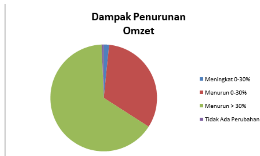
Gambar 1. 3 Data Dampak Pandemi COVID - 19 Terhadap Omzet Usaha Brand Fashion Kota Bandung

usaha) yang terdampak COVID-19, akibat dari pandemi COVID-19 ada beberapa perubahan omset usaha. Di mana sebanyak 63,9 persen para pelaku usaha mendapati penurunan omset usaha lebih dari 30 persen dan sebesar 31,7 persen para pelaku usaha mendapati penurunan kurang dari 30 persen. Sebanyak 2,2 persen yang mengalami kenaikan omset kurang dari 30 persen dan terdapat 1,6 persen yang mendapati peningkatan omset usaha lebih dari 30 persen. Dan sisanya, terdapat 0,6 persen yang tidak mendapati perubahan signifikan terkait omset usahanya.