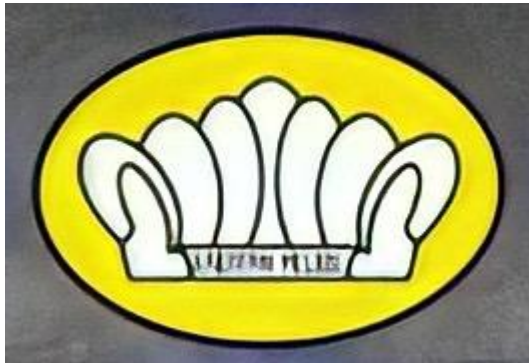
Gambar 1.1 Logo Perusahaan Harapan Mebel

Harapan Mebel merupakan sebuah bisnis yang bergerak dibidang UMKM mebel yang didirikan pada tahun 2006 yang beralamatkan di Jl. KH. Hasan Arief, No. 477, Desa Sukasenang, Kecamatan Banyuresmi, Kota Garut, Kota Garut, Provinsi Jawa Barat. Berikut logo perusahaan Harapan Mebel pada gambar 1.1 dibawah ini.