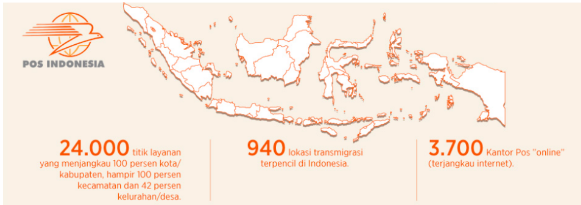
Gambar 1.3 Jaringan Pos Indonesia

Tidak hanya memperluas jaringan, PT Pos Indonesia juga berinovasi dengan produknya. Walaupun PT Pos Indonesia telah mencoba untuk berinovasi untuk mengikuti perkembangan digital, PT Pos Indonesia tetap tidak menghilangkan layanan pengiriman surat dan dokumen. Dalam penelitian Rahmat (2022), Hardiyana selaku Public Relations Pos Indonesia mengatakan bahwa hal tersebut dilakukan untuk tetap tidak menghilangkan karakter heritage yang dimiliki perusahaan. Dengan demikian, Pos Indonesia tetap memiliki brand identity layanan pos surat dan dokumen yang melekat.