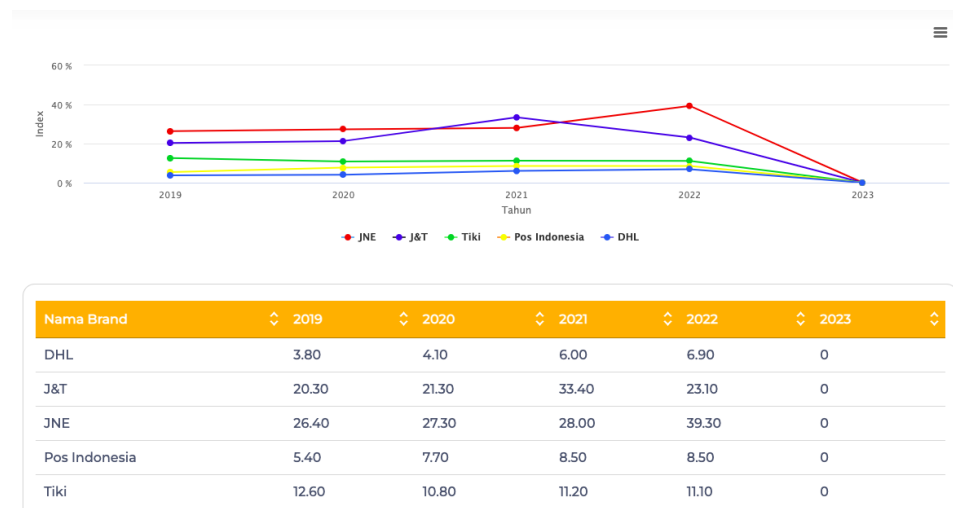
Gambar 1. 2 Top Brand Index Jasa Pengiriman di Indonesia Tahun 2019 - 2022

PT Pos Indonesia telah banyak melakukan inovasi terutama di layanannya yang sekarang telah masuk ke digitalisasi yaitu penggunaan aplikasi yang dapat mempermudah masyarakat untuk menggunakan jasa layanan PT Pos Indonesia. Sayangnya, dengan banyaknya upaya PT Pos Indonesia yang telah mengikuti perkembangan digital dan terus berinovasi dengan produknya, tengah banyaknya pelanggan yang lebih melakukan pemilihan guna memakai produk kompetitor PT Pos Indonesia. Dilansir dari ajang penghargaan yang diberi terhadap brand-brand yang memiliki performa sangat baik di pasar Indonesia yaitu Top Brand Award , Pos Indonesia menduduki peringkat keempat dari lima brand yaitu JNE, JNT, TIKI dan DHL.