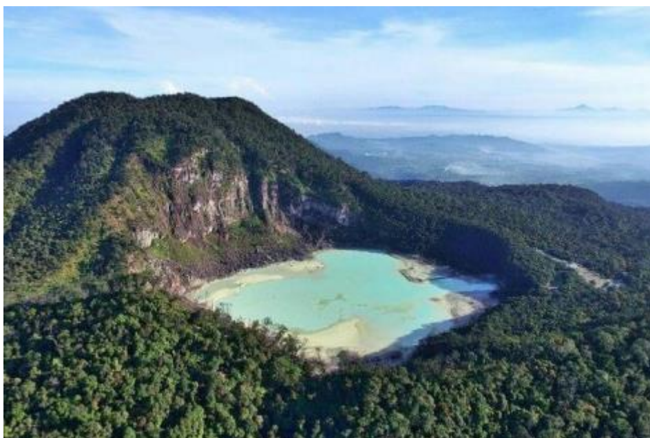
Gambar 1. 2 Gambar Gunung Patuha dan Kawah Putih

Gunung Patuha adalah gunung berubah besar yang lereng dan kakinya menjalar ke tiga desa: desa Cipanganten dan desa Sugihmukti di Kecamatan Pasotjambu dan desa Alam Endah di Kecamatan Rancabali. Namun, masyarakat lebih suka menyebutnya berada di Kawasan Ciwidey saja. [3]