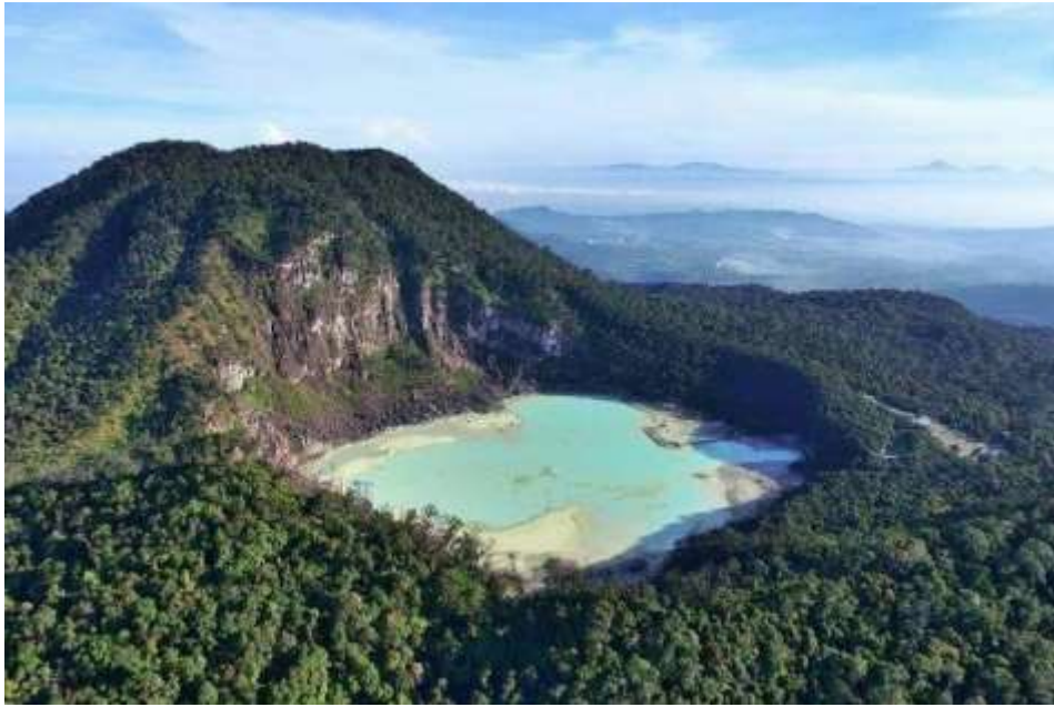
Gambar 1. 2 Gambar Gunung Patuha dan Kawah Putih

Gunung Patuha adalah gunung berubah besar yang lereng dan kakinya menjalar ke tiga desa: desa Cipanganten dan desa Sugihmukti di Kecamatan Pasotjambu dan desa Alam Endah di Kecamatan Rancabali. Namun, masyarakat lebih suka menyebutnya berada di Kawasan Ciwidey saja. [3]