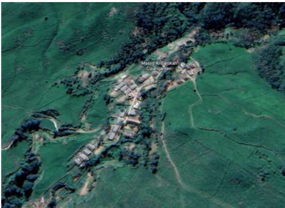
Gambar 1.1 Desa Cipanganten

Penelitian menunjukkan bahwa internet memiliki banyak manfaat, termasuk sarana komunikasi dan konektivitas, kemudahan untuk bisnis, akses informasi, pengetahuan dan pendidikan, pemetaan dan alamat, dan hiburan. Internet adalah jaringan global yang menghubungkan komputer dengan koneksi internet, setiap orang di seluruh dunia dapat berkomunikasi dan berbagi data. Saat ini, internet sangat penting untuk banyak hal. Sementara dikutip dari Kominfo.go.id. , Sekitar 15 ribu desa dilaporkan memiliki akses internet yang buruk atau sama sekali tidak dapat terhubung ke internet, yang membuat mereka menjadi tempat blankspot. [2]