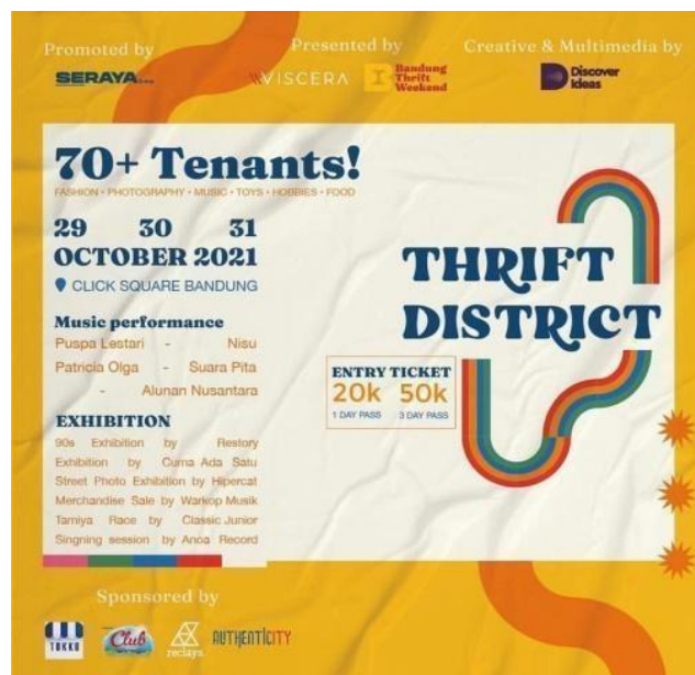
Gambar 1. 1 Flyer Event Thrift District

Fungsi Public Relations dalam mencapai tujuan Bandung Thrift Weekend yakni untuk meningkatkan minat para masyarakat untuk datang ke acara Bandung Thrift Weekend , seorang MPR tentunya harus memiliki Strategi Marketing Public Relations sebagai suatu rencana yang diutamakan untuk dapat mencapai tujuan event ini. Dengan Melihat hambatan-hambatan yang ada para penyelenggara Bandung Thrift Weekend harus berpikir keras untuk menciptakan Strategi Marketing Public Relations terbaik agar dapat menarik minat masyarakat banyak.