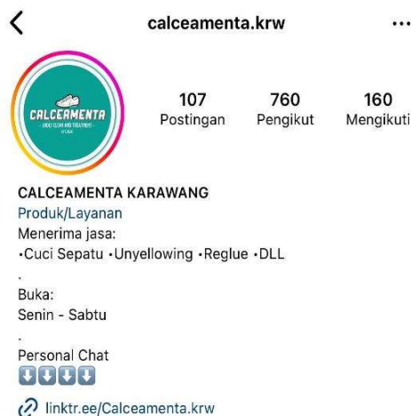
Gambar 1. 1 Profil Instagram Calceamenta Karawang

Pada Instagram Calceamenta Karawang memberikan informasi lengkap mengenai detail jasa, tempat usaha, dan jadwal usaha, dan personal chat yang tidak jelaskan bahwasanya calceamenta karawang dapat menjemput dan mengantarkan kembali sepatu konsumen. Selain itu calceamenta kurang memanfaatkan caption disetiap foto untuk menarik minat konsumen. Dan hampir semua postingan yang ada di sosial media Instagram Calceamenta terlalu fokus pada pelayanan kepada konsumen dengan sering memposting testimoni untuk kepercayaan konsumen.