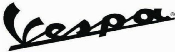
Gambar 1 2 Logo Vespa

dampak perang dunia di mana perekonomian Italia pada saat itu dalam keadaan krisis, Enrico memutuskan untuk mendesain dan membuat alat transportasi yang murah dan bekerja sama dengan Corradino D'Ascanio yaitu seorang insinyur di bidang penerbangan yang membuat helikopter modern pertama Piaggio. Akhirnya Corradino D'Ascanio membuat revolusi kendaraan baru dengan rancangan yang simpel, ekonomis, nyaman dan elegan. Rancangan dengan mengambil gambaran dari pesawat terbang, kendaraan dengan menggunakan " monocoque " yaitu garpu depan yang menjepit ban seperti ban pesawat sehingga mempermudah untuk penggantian ban. Lalu lahir pertama kali produk motor dengan seri MP5 (motor piaggio 5) paperino pada tahun 1943. MP5 ini di sebut paperino, karna bentuknya yang mirip dengan ( donald duck ) lalu D'Ascanio memperbaiki model tersebut, mengonsep dan mendesain ulang kendaraannya. Dan lahir prototipe MP6, dengan model yang baru yang berbeda dengan kendaraan lainnya, saat melihat kendaraan tersebut Enrico Piaggio berkata "Sambra Una Vespa" yang artinya seperti lebah dan akhirnya kendaraan ini dinamakan Vespa.