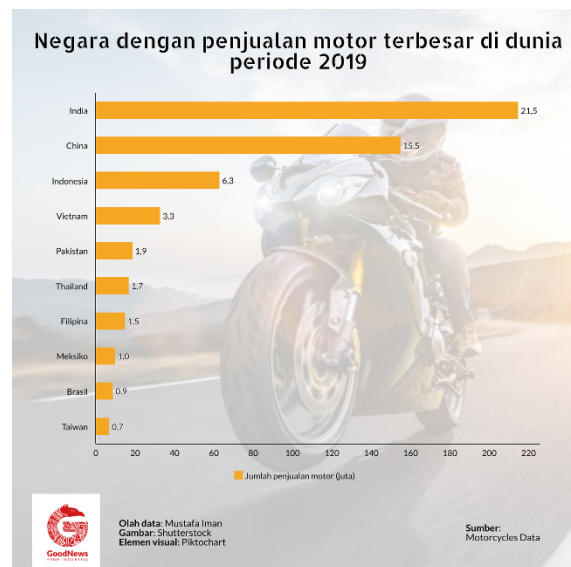
Gambar 1 3 Data Negara Dengan Penjualan Motor Terbesar Di Dunia